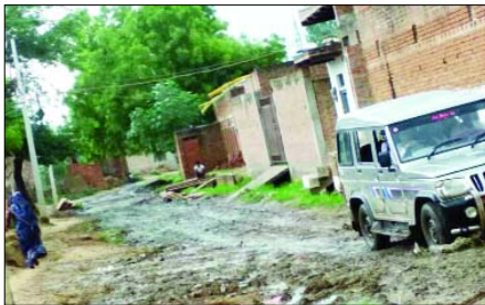
दबोह (मोहित गोस्वामी)