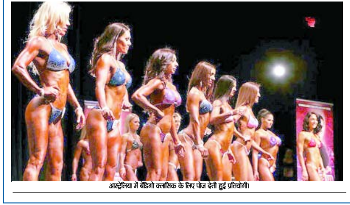
ऑस्ट्रेलिया में बीडिंगो क्लासिक के लिए पोज देती हुई प्रतिस्पर्धी