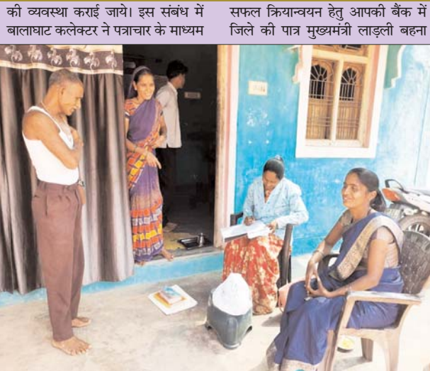
से सभी बैंकों को निवेदन किया है कि शासन की उक्त महत्वाकांक्षी योजना के को आवश्यक सहयोग प्रदान करेगी। अधीन बैंकों का तत्संबंधी निर्देश प्रसारित

रितेश कटरे ब्यूरो चीफ पुष्पांजली टुडे बालाघाट मध्यप्रदेश शासन महिला एवं बाल विकास विभाग मंत्रालय द्वारा जारी निर्देशानुसार प्रदेश में महिला सशक्तिकरण की दिशा में महिलाओं के आर्थिक स्वावलंबन, उनके स्वास्थ्य एवं पोषण स्तर में सतत सुधार एवं परिवार के निर्णयों में उनकी भूमिका सुदृढ़ करने की दृष्टि से शासन द्वारा मुख्यमंत्री लाडली बहना योजना -2023 प्रारंभ की गई है। योजना में पात्र महिलाओं को 1000 रुपये की राशि प्रति माह उनके स्वयं के आधार लिंकड - डीबीटी इनेबलड बैंक खाते में जमा की जायेगी। शासन की उक्त योजना का लाभ प्राप्त करने हेतु महिलाएं बैंक में खाता खुलवाने, इकेवायसी अपडेट करवाने, आधार अपडेट करवाने आदि कार्य हेतु बैंक में सम्पर्क करेंगी, उनके कार्य का त्वरित गति से निराकरण हो जाये, इस हेतु यह आवश्यक होगा कि योजनागत लाभ प्राप्त करने हेतु आई हुई महिलाओं के लिये एक पृथक काउण्टर