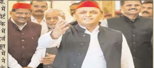
जांच में हुई तरकी की किसी को जानकारी नहीं है। सीबीआई ने चीकाने वाला जवाब देते हुए कहा कि

उसे शुरुआती जांच में निर्यात एफआईआर दर्ज करने लायक सबूत नहीं मिले थे। इसलिए, अगस्त 2013 में ही जांच बंद कर दी गई थी। सीबीआई ने जवाब में आगे लिखा कि उसने अपना कानूनी दायित्व निभाते सुनवाई कर रहे तत्कालीन चीफ जस्टिस रंजन गोगोई और जस्टिस दीपक गुप्ता की बेंच ने इस बात पर हैरानी जताई कि 12 साल बाद भी जांच में कोई प्रगति नहीं है। आगे की जानकारी के लिए इनसे संपर्क करें। याचिकाकर्ता का दावा है कि सीबीआई ने उन्हें कोई जानकारी नहीं कराई है।