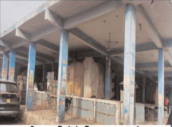
सब्जी व्यापारियों के लिए बना काम्प्लेक्स