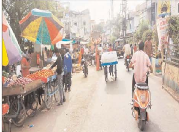
सड़को पर जाम के हालात

रीतेश अवस्थी पुष्पांजली टुडे दमोह। नगरपालिका प्रशासन द्वारा वर्ष 2016-17 में करोड़ों की लागत से कचौरा मार्केट में सब्जी शॉपिंग काम्प्लेक्स का निर्माण कराया गया, लेकिन फुटकर एवं हाथ ठेला पर दुकान संचालित करने वालों को नगरपालिका के द्वारा काम्प्लेक्स में भेजने का कोई प्लान तैयार नहीं किया गया जिससे काम्प्लेक्स पूरा खाली पड़ा रहता है जबकि यह काम्प्लेक्स दुकानदारों के लिए नगरपालिका के द्वारा निर्माण कार्य कराने का मुख्य