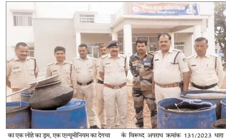
का एक लोहे का ड्रम, एक एल्यूमीनियम का देगाच के विरुद्ध अपराध क्रमांक 131/2023 धारा

1200 लीटर गुड़ का लहान भरा हुआ था जिसे मौके पर नष्ट किया गया ती मौके से शराब बनाने