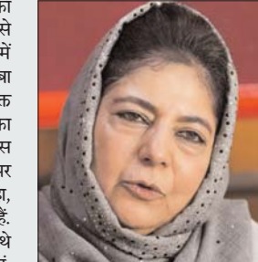
वो गैर इस्लामिक है. महबूबा की पूजा इस्लाम के खिलाफ है. बीजेपी ने महबूबा के मंदिर जाने को ड्रामा बताया है. पार्टी ने कहा कि कभी महबूबा ने अमरनाथ धाम के लिए जमीन देने से इनकार कर दिया था. जम्मू-कश्मीर बीजेपी के प्रवक्ता