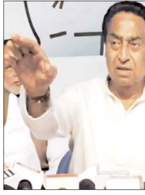
दल-आदिवासी युवती की कथित तौर पर बलात्कार के बाद महु के बड़गाँडा थाना क्षेत्र की