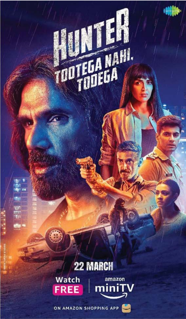
सुनील शेट्टी की एक्शन सीरीज हंटर का ट्रेलर जारी