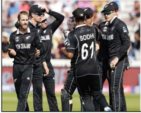
जुड़ने का मौका मिलेगा। टीम के (रॉयल चैलेंजर्स बेंगलोर), लॉकी तीन अन्य खिलाड़ी फिन एलेन फार्ग्युसन (केकेआर) और ग्लेन

वेलिंगटन। केन विलियमसन और टिम साउदी सहित न्यूजीलैंड के चार खिलाड़ियों को देश के क्रिकेट बोर्ड ने श्रीलंका के खिलाफ सीमित ओवरों की घरेलू श्रृंखला में हिस्सा लिए बिना अपनी संबंधित इंडियन प्रीमियर लीग टीमों में शामिल होने के लिए हरी झंडी दे दी। विलियमसन (गुजरात टाइटन्स), साउदी (कोलकाता नाइट राइडर्स), डेवोन कॉन्वे और मिचेल सेंटनर (दोनों चेन्नई सुपर किंग्स) की चौकड़ी शुक्रवार से यहां श्रीलंका के खिलाफ शुरू होने वाले दूसरे और अंतिम टेस्ट के बाद राष्ट्रीय टीम की जिम्मेदारी से मुक्त हो जायेंगे। उन्हें इससे अपनी आईपीएल फेंचइजी टीमों से जल्दी