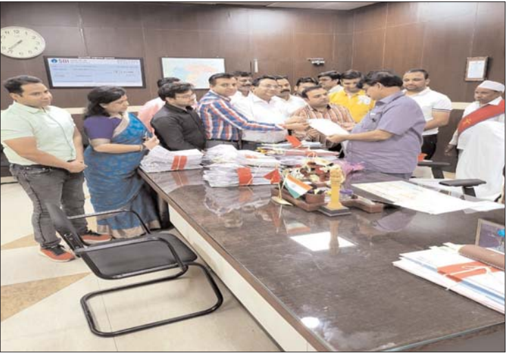
गड्डे है और अधिकतम जगह रोड ही नहीं है, पेयजल भी व्यापारियों से नगर निगम वर्ष 2014-15 से ही

रहे हैं। गंदगी के अम्बार है, यहाँ कोई भी सफाई कर्मी नहीं आता है, नाले नाली व सीवर चोक है, रोड पर की कोई व्यवस्था नहीं है, पार्किंग पर अतिक्रमण है। इन सभी बुनियादी सुविधाओं के वंचित होने के बाद