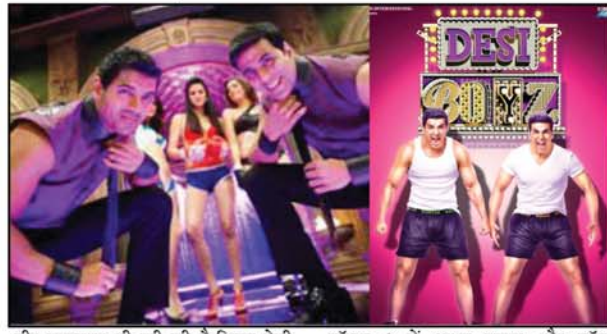
वीर सावरकर भी पूरी की है। फिल्म देसी बॉयज 2 में अक्षय कुमार और जॉन

बॉलीवुड एक्टर अक्षय कुमार और जॉन अब्राहम के फैस के लिए एक बड़ी खबर सामने आ रही है। लेटेस्ट रिपोर्ट में दावा किया जा रहा है कि देसी बॉयज का सीक्रेल बनने जा रहा है और सीक्रेल यानी देसी बॉयज 2 में सैम कास्ट नजर आने वाले हैं। आपको बता दें, फिल्म देसी बॉयज में अक्षय कुमार और जॉन अब्राहम के साथ दीपिका पादुकोण और चित्रांगदा सिंह भी थीं। फिल्ममेकर आनंद पंडित ने कहा कि उनकी फर्म कई भाषाओं में कई फिल्मों पर काम कर रही है। उनके पास देसी बॉयज 2, द विंग बूल, सरकार 4 और ओमकारा का रिमेक है। हमने फिल्म