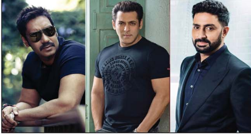
ही रखा गया है, लेकिन बहुत सारे किरदार और पटकथा का थोड़ा सा हिस्सा बदल गया है। भोला को और भी

की पुष्टि कर दी है कि भोला के साथ एक यूनिवर्स की शुरुआत होने वाली है। अभिनेता ने कहा, कैथी विक्रम के यूनिवर्स का हिस्सा है, जिसमें विक्रम (1986) और विक्रम (2022) शामिल हैं। भोला एक ऐसे नोट पर खत्म होगी, जहां आपको लोगो कि इसका दूसरा पार्ट भी होगा। उन्होंने कहा, यह दूसरा पार्ट विक्रम या उसके जैसा नहीं होगा क्योंकि हम अलग तरह के नए किरदार लाएंगे। भोला दुनियाभर में 3डी, आईमैक्स और 4डीएक्स में रिलीज होने वाली है। अजय ने फिल्म के बारे में कहा, यह फिल्म बड़े पैमाने पर बनाई गई है, जिसमें भरपूर एक्शन है। हमने जो वातावरण और परिवेश बनाया है, वो कुछ ऐसा है जो मुझे नहीं लगता कि लोगों ने ज्यादा देखा है। अभिनेता ने बताया कि फिल्म की कहानी को वैसा