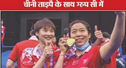
फाइनल में भी नहीं पहुंच सका। भारत ने फरवरी में बैडमिंटन एशिया मिश्रित टीम चैम्पियनशिप में कांस्य पदक जीतकर सुदीरमन कप के लिये क्वालीफाई किया था। इस टूर्नामेंट में 16 टीमों में भाग लेंगे

नयी दिल्ली। भारतीय बैडमिंटन खिलाड़ियों को सुदीरमन कप फाइनल्स में पेचीदा झूँ मिला है जिसमें उरु रफू सी में मलेशिया और चीनी ताइपै के साथ रखा गया है। सुदीरमन कप 14 से 21 आई के बीच चीन के सुझोउ में खेला जायेगा। रफू सी में चौथी टीम आस्ट्रेलिया है। भारत ने 2011 और 2017 सुदीरमन कप में अपना सर्वश्रेष्ठ प्रदर्शन किया लेकिन पिछले दो सत्र में भारत क्वार्टर