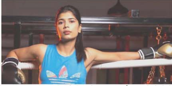
किया ताकि वह साबित कर सकें कि महिलायें भी इस खेल में अच्छे कर सकती हैं। तेलंगाना के निजामाबाद में मुस्लिम परिवार से आकर मुक्केबाजी की

नयी दिल्ली। एमसी मैरीकॉम ने एक बार गुस्से से पूछा था, निकहत जरीन कौन है? निकहत ने 2022 में विश्व चैम्पियनशिप में स्वर्ण पदक जीतकर इस सवाल का जवाब दिया था। और अब रविवार को एक बार फिर उन्होंने अपना दूसरा विश्व चैम्पियनशिप खिताब जीत लिया, वो भी घरेलू दर्शकों के सामने जिससे वह यह उपलब्धि हासिल करने वाले दूसरी भारतीय मुक्केबाज बनीं। इसके साथ ही वह छह बार की विश्व चैम्पियन मैरीकॉम के उत्तराधिकारी के तौर पर आगे बढ़ती दिख रही हैं। निकहत ने 50 किग्रा वजन वर्ग का खिताब जीतने के बाद कहा, मैं दूसरी बार विश्व