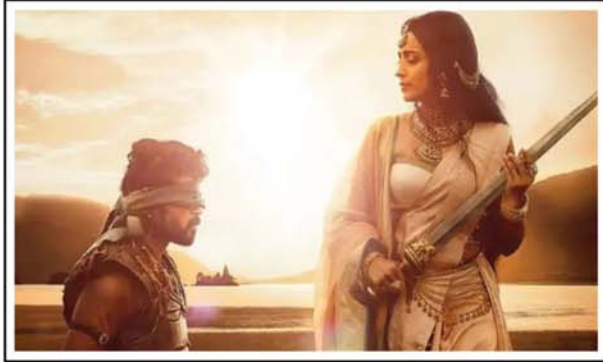
रिलीज- लायका प्रोडक्शन ने अपने टि्वटर हैंडल पर मूवी पोन्नियन सेल्वन 2 का पोस्टर साझा किया है। इस पर लीड स्टार ऐश्वर्या राय बच्चन और चियान विक्रम दिखाई दे रहे हैं। पोस्टर पर बताया गया है कि मूवी का ट्रेलर 29 मार्च यानी बुधवार को रिलीज किया जाने वाला है।

साउथ मूवी का बॉक्स ऑफिस पर बोलबाला बना हुआ रहता है और फैंस भी इनका बेसब्री से प्रतीक्षा भी करते हैं। साउथ मूवी इंडस्ट्री के पॉपुलर डायरेक्टर मणिरत्नम की मूवी पोन्नियन सेल्वन बीते वर्ष 2022 में 30 सितंबर को सिनेमाघरों में रिलीज हुई और जबरदस्त कारोबार किया। अब फिल्म का दूसरा पार्ट पोन्नियन सेल्वन 2 28 अप्रैल, 2023 को सिनेमाघरों में रिलीज होने जा रहा है। इसी बीच मेकर्स ने मूवी पोन्नियन सेल्वन 2 के ट्रेलर को रिलीज करने की डेट का भी खुलासा कर दिया है। पोन्नियन सेल्वन 2 का ट्रेलर 29 मार्च को होगा