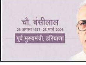
चौ. बंसीलाल 26 अगस्त 1927-28 मार्च 2006 पूर्व मुख्यमंत्री, हरियाणा