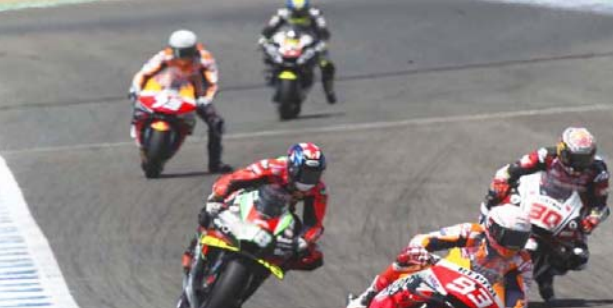
सोन में स्पेनिश मोटरसाइकिल मुकाबले में मोटो जीपी राइडर मार्क मारक्रेज आगे निकलते हुए।

नहीं करेंगे। अनुशासन और आत्मनियंत्रण को यह सराहनीय प्रक्रिया अब मान्य नहीं है क्योंकि डीआरएस को लागू किए जाने से खिलाड़ियों के विरोध के एक तरीके को बढ़ावा दिया जा रहा है। चैपल ने इंग्लैंड और वेस्टइंडीज के बीच जारी वर्तमान श्रृंखला का उदाहरण देते हुए कहा कि डीआरएस से हेरफेर किया जा रहा है जिससे इसका महत्व कम हो रहा है। चैपल ने कहा कि खिलाड़ियों को कभी फैसला लेने की प्रणाली का हिस्सा बनने की स्वीकृति नहीं दी जानी चाहिए। उन्होंने लिखा, 'ऐसा समय था जब बीसीसीआई को डीआरएस पर भरोसा नहीं था। वहीं मुझे अब भी डीआरएस पर अधिक भरोसा नहीं है। शुरू से ही डीआरएस अपायों के हाथ में होना चाहिए था, खिलाड़ियों को फैसला करने की प्रणाली का हिस्सा नहीं बनाया जाना चाहिए।' साथ ही कहा कि डीआरएस से जुड़े उपकरणों और कर्मचारियों पर टीवी प्रोडक्शन कंपनी की जगह क्रिकेट अधिकारियों का नियंत्रण होना चाहिए।