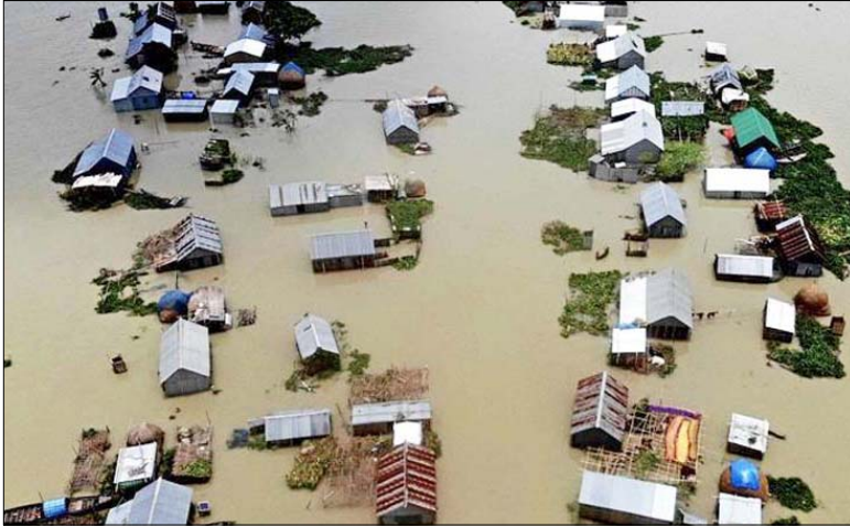
बांग्लादेश में बाढ़ के कारण कई घर पानी में डूब गये।