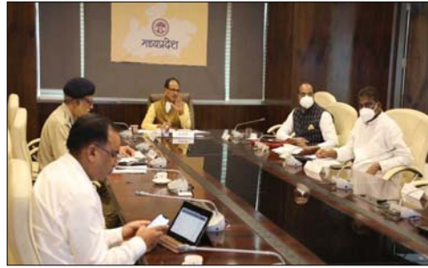
मुख्यमंत्री श्री चौहान ने कहा कि कोरोना संक्रमण की रोकथाम के लिए स्वास्थ्यसेवाओं को और बेहतर करने के साथ-साथ भौंड प्रबंधन पर विशेष ध्यान

भोपाल। मुख्यमंत्री श्री शिवराज सिंहचौहान ने कहा है कि कोविड-19 के संक्रमण को रोकना हमारी सर्वाच्च प्राथमिकता है। संक्रमणकी रोकथाम के साथ-साथ आमजनों को किसी भी प्रकार की परेशानी न हो यह भी सुनिश्चित किया जाए। आर्थिक गतिविधियों फिर चलती रहें और कोविड का संक्रमण न फैले इस दिशा में प्रभावीकार्यवाही की जाए। मुख्यमंत्री श्री शिवराज सिंह चौहान ने सोमवार को ग्वालियर प्रवास के दौरान विमान तल पर कोरोनासंक्रमण के संबंध में अधिकारियों से चर्चा करते हुए यह निर्देश दिए। मुख्यमंत्री श्री चौहान ने कहा कि इस बात का ध्यान रहे कि लोकडाउन के कारण आमजनों एवंरोज कमा कर खाने वाले छोटे-छोटे व्यवसायों को परेशानी न हो। साथ ही आर्थिक गतिविधियों भी चलती रहें। उन्होंने संक्रमणकी रोकथाम के लिए प्रभावी कार्यवाही करने के साथ-साथ आमजनों को जागृत करने के लिए भीविशेष प्रयास करने के निर्देश दिए।