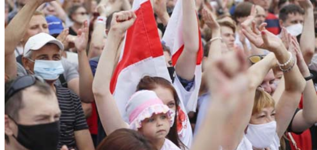
बेलाहस में राष्ट्रपति पद के उम्मीदवार स्तेनाना रिचानोवास के समर्थन में नारे लगाते हुए लोग।