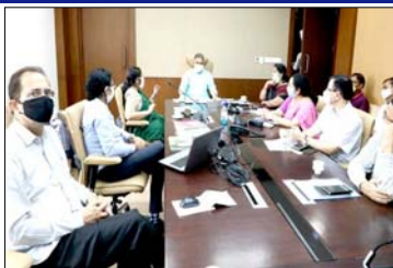
सकेंगे। उन्होंने कहा कि स्कूल शिक्षा विभाग द्वारा संचालित किये जा रहे प्री-प्रायमरी शिक्षा स्कूलों के लिये विस्तृत कार्य-