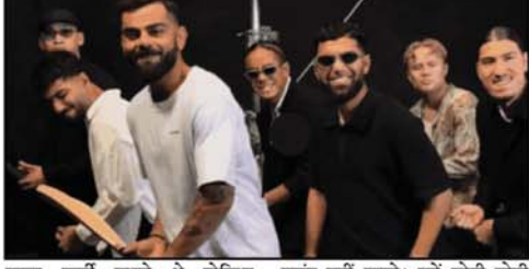
नाइट पार्टी करते थे लेकिन वामिका के जन्म के बाद वे संभव नहीं हैं। वे कोई एक्सक्लूजिव नहीं, रियलटी हैं। बच्चे के जन्म के बाद आप बहुत ज्यादा सोशल नहीं हो सकते। हम इससे खुश हैं, क्योंकि हम दोनों ही ज्यादा सोशल रहना

विराट कोहली और अनुष्का शर्मा 24 मार्च को इंडियन स्पोर्ट्स ऑनर्स अवॉर्ड्स में शामिल हुए। इस दौरान उन्होंने एक कहा कि वो पहले की तरह अब लेट नाइट पार्टीज में नहीं जाते। पहले वो रात तीन बजे तक जागते थे लेकिन अब ऐसा नहीं है। अब वो 9.30 बजे तक सो जाते हैं। विराट ने कहा- पहले 2-3 ड्रिंक के बाद मैं रातभर डांस करता था। अब ड्रिंकिंग छोड़ दी है। विराट और अनुष्का ने स्टार स्पोर्ट्स को दिए इंटरव्यू में यह बातें कहीं। अनुष्का ने कहा, अब हम रात 9:30 बजे तक अपने बेड पर होते हैं। पहले रात 3 बजे तक जागते थे, लेट