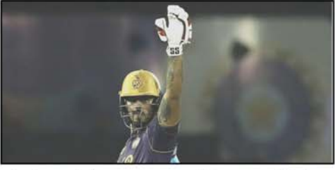
चोट से उबर रहे हैं। हम उम्मीद लगाते हैं कि श्रेयस इससे उबरकर आईपीएल 2023 के चरण के कुछ हिस्से में खेलेंगे। हम भाग्यशाली हैं कि हमारे पास नीतिश जैसा खिलाड़ी है जिनके पास सफेद गेंद के क्रिकेट में अपनी राज्य की टीम की अगुआई

कोलकाता। कोलकाता नाइट राइडर्स (केकेआर) ने सोमवार को बायें हाथ के बल्लेबाज नीतिश राणा को इंडियन प्रीमियर लीग (आईपीएल) के आगामी चरण के लिए टीम का नया कप्तान चुना। राणा इससे श्रेयस अख्यर की जगह लेंगे जिनके पीठ की सर्जरी कराने की संभावना है जिससे उनके पूरे सत्र से बाहर रहने का खतरा मंडरा रहा है। बल्लि केकेआर के बयान से साफ संकेत मिलता है कि अख्यर के जल्दी वापसी करके खेलने की संभावना असंभव दिखती है। केकेआर के बयान के अनुसार, श्रेयस अख्यर की अनुपस्थिति में नीतिश राणा टीम के कप्तान होंगे। अख्यर पीठ की