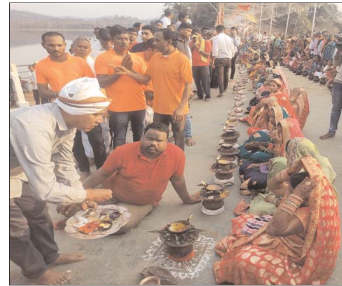
उपरांत हवन पूजन का आयोजन हुआ। जो दोपहर तक चलता रहा। संस्था बेला में ज्योति प्रातः समय में यहां जलारे विसर्जन किए जाएंगे। तथा श्रद्धालुओं को महाप्रसाद खिलाई जाएगी।

कलशों की शोभायात्रा निकालकर देर रात तक जल दर्शन कराए गए इस उपरांत प्रसादी का वितरण किया गया। इस दौरान हजारों की संख्या में भक्तगण उपस्थित रहे। आज 30 मार्च को