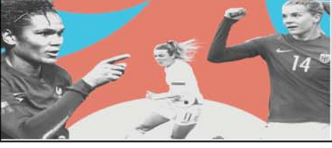
दोनों देशों के बीच सांस्कृतिक संबंधों को और बेहतर बनाने की दिशा में महत्वपूर्ण पहल कर रहे हैं। उन्होंने कहा कि फुटबॉल भारत में लोकप्रिय हो रहा है और इस प्रकार की कोशिशों से न सिर्फ भारत और स्पेन के रिश्ते मजबूत होंगे बल्कि नये क्षेत्रों में गठजोड़ के अवसर भी बढ़ेंगे। ला लिंगा के प्रबंध निदेशक जोस एंटोनियो कचाजा ने कहा कि फुटबॉल आने वाले समय में भारत और स्पेन के बीच संबंधों को और प्रगाढ़ बनाने का महत्वपूर्ण आधार बनेगा।

नयी दिल्ली। स्पेन के इन्स्टिट्यूटो सर्वेटीस और ला लिंगा लीग ने सोमवार को नयी दिल्ली स्थित स्पेन के दूतावास में स्पैनिश-हिन्दी फुटबॉल शब्दकोष का लोकार्पण किया। एक बयान के अनुसार शब्दकोष का विमोचन भारत में स्पेन के राजदूत जोस मारिया रिडोओ ने किया। इस अवसर पर दिल्ली में इन्स्टिट्यूटो सर्वेटीस के निदेशक ऑस्कर पुजोल् और ला लिंगा इंडिया के प्रबंध निदेशक जोस एंटोनियो कचाजा भी मौजूद थे। स्पेन के राजदूत जोस मारिया रिडोओ ने कहा कि हम पहले ही स्पैनिश बाल्ला संस्करण पेश कर चुके हैं और आज स्पैनिश-हिन्दी फुटबॉल शब्दकोष जारी करके हम