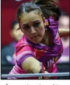
और आरपीएसजी मावेरिक्स कोलकाता शामिल हैं। चेन्नई लायंस इस सत्र का हिस्सा नहीं है जिसने 2019 में खिताब जीता था।