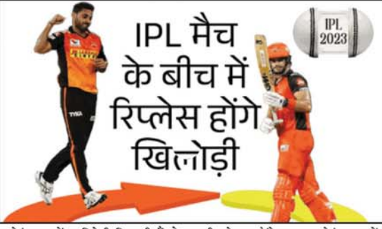
प्लेइंग-11 में 3 विदेशी खिलाड़ी हैं तो विदेशी भी इम्पैक्ट प्लेयर के रूप में किसी खिलाड़ी को रिप्लेस कर सकेंगी। इस तरह एक टीम से मैच में 4 विदेशी

फायदा मिलेगा। इम्पैक्ट प्लेयर नियम के तहत डूबक मैच के बीच टीमों प्लेइंग-11 में शामिल किसी एक खिलाड़ी को बेंच पर बैठे खिलाड़ी से रिप्लेस कर सकेंगी। टीमों को टॉस के बाद प्लेइंग-11 के साथ 4-4 सब्सटिट्यूट खिलाड़ी भी बताने होंगे। इन्हें 4 में से कोई एक प्लेइंग-11 में शामिल खिलाड़ी को बीच में रिप्लेस कर सकेंगी। टीमों उस खिलाड़ी को भी रिप्लेस कर सकती है जो मैच में बैटिंग या बॉलिंग कर चुका हो। इम्पैक्ट प्लेयर को मैच में अपने खाते के पूरे चार ओवर गेंदबाजी करने के मिलेंगे। साथ ही वह पूरे ओवर बल्लेबाजी भी कर पाएगा। हालांकि, एक इनिंग में किसी टीम के ज्यादा से ज्यादा 10 विकेट ही गिर सकते हैं। हां, अगर