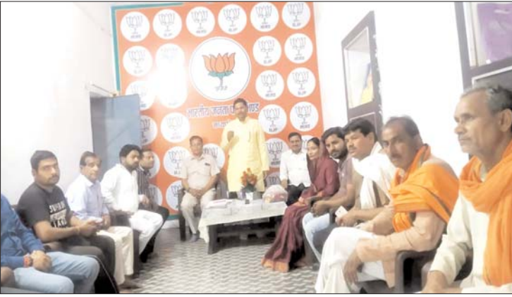
जोड़कर पार्टी 22 कारों को प्रत्येक बूथ पर सफलता कहां कि भूत हमारी निरंतर चलने वाली का ही है

विस्तार अभियान 2 के मैं बूथ के सभी कार्यकर्ता के साथ पहुंचना है हमारा भूत मजबूत होगा उन्होंने