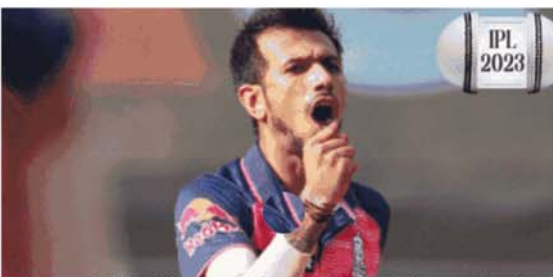
करते हुए अपनी टीम को मैच जिताए हैं। मलिंगा रिटायर हो चुके हैं और अब अपनी एकमात्र डूबक टीम मुंबई इंडियंस में बॉलर्स को कोचिंग देते हैं। भारतीय लेग स्पिनर अमित डूबक लीजेंड हैं। अपने पूरे करियर

मैचों में उन्होंने 39.3व डॉट बॉल फेंकी। स्लोअर बॉल फेंकने में माहिर ब्रावो हर 17वीं बॉल और 24 रन देने में एक विकेट लेते हैं। ब्रावो संन्यास ले चुके हैं और इस सीजन में डूबक खेलते नजर नहीं आएंगे। श्रीलंकाई लीजेंड लसिथ मलिंगा का साइड आर्म बॉलिंग एक्शन, लगातार यॉर्कर और स्लोअर बॉल फेंकने की क्षमता उन्हें दुनिया के सबसे खतरनाक टी-20 बॉलर्स में से एक बनाती है। 122 मैचों में 170 विकेट लेने वाले मलिंगा ने अपने डूबक करियर में 48व गेंदें डॉट कराईं। 7.14 के बेहतरीन इकोनॉमी रेट के साथ उन्होंने हर 20वीं बॉल पर एक विकेट लिया है। कई बार डेथ ओवर्स में गेंदबाजी