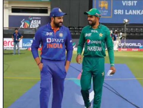
एशिया कप टूर्नामेंट के ज्यादातर भारतीय टीम के जितने भी मैच होंगे, उन्हीं घरेलू, ओमान या श्रीलंका में से