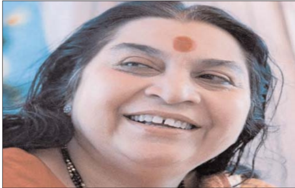
यानि कि ऋद्धंभरा प्रज्ञा इस संपूर्ण जगत में व्याप्त है। समस्त प्राणियों फल, फूल और सभी नैसर्गिक चीजों में व्याप्त है इसे ही

अस्तु का विवेक, नवनिर्माण करने की शक्ति जिसे सृजनशक्ति कहते हैं, समाधान, आत्मविश्वास, साक्षात्भाव, क्षमाशीलता इत्यादि अनेक गुण आपमें विकसित होते हैं। भगवद्गीता कहती है, 'उर्ध्व मूलं अधः शाख अर्थात् आपको व्यक्तित्व की जड़ें आपको मस्तिष्क में हैं और सहजयोग ध्यान से धीरे - धीरे आप समझने लगते हैं परमेश्वर की शक्ति तो असीम है, अगणित है परंतु हर दिन आपको परमेश्वर की इस शक्ति का तालुभाग ( सहस्त्रार ) में एकीकरण हो रहा है, समग्रता आ रही है। इस आध्यात्मिक आनंद का अनुभव दिन - प्रतिदिन ध्यान धारणा की गहनता के साथ - साथ बढ़ता ही जाता है। सहजयोग से संबंधित जानकारी निम्न साधनों से प्राप्त कर सकते हैं। यह पूर्णतया निशुल्क है। टोल फ्री नं 1800 2700 800 बेवसाइट डूट्यूब चैनल लर्निंग सहजयोगो प्रति शनिवार शाम 06-30 बजे।