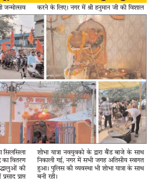
शोभा यात्रा नवयुवकों के द्वारा बैंड बाजे के साथ निकाली गई, नगर में सभी जगह अतिथीय स्वागत हुआ। पुलिस की व्यवस्था भी शोभा यात्रा के साथ बनी रही।

कोटा। आज 6 अप्रैल को श्री हनुमान जी जन्मोत्सव करने के लिए। नगर में श्री हनुमान जी की विशाल पूरे भारत में हर्षोल्लास के साथ मनाया गया। कोटा नगर में सभी शिव हनुमान मंदिरों में सुबह से भीड़ बनी रही, विशेष पूजा अर्चना के साथ श्री हनुमान जी की आराधना की गई। स्टेशन रोड शिव हनुमान मंदिर काफी प्राचीन मंदिर है यहां भगवान शिव अपने परिवार के साथ विराजमान है और वहीं श्री हनुमान जी शंकर जी के ग्यारहवें अवतार के रूप में शंकर स्वयं केशरीनंदन के रूप में विराजमान है। ऐसी मान्यता है कि यहां इस मंदिर में श्री हनुमान जी की जो भाव सहित पूजा आराधना करता है, अपनी अर्जा लगाता है तो उसकी मनोकामना श्री हनुमान जी अवश्य पूरी करते हैं। इस मंदिर में सुबह से पूजा आराधना का सिलसिला जारी रहा और सुबह से ही भंडारा प्रसाद का वितरण भक्तों के द्वारा किया जा रहा था। श्रद्धालुओं की भीड़ उमड़ती रही दर्शन और भंडारा में प्रसाद प्राप्त