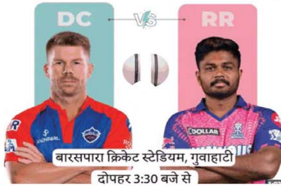
बारसपारा क्रिकेट स्टेडियम, गुवाहाटी

जानेंगे- दिल्ली कैपिटल्स का इस सीजन में यह तीसरा मुकाबला होगा। टीम को उसके दोनों शुरुआती मुकाबलों में हार मिली। उन्हें सीजन में पहली जीत की तलाश है। दिल्ली को पहले मुकाबले में लखनऊ सुपरजायंट्स ने 50 रन से, वहीं दूसरे मैच में गुजरात टाइटंस ने 6 विकेट से हराया था। राजस्थान के खिलाफ टीम के 4 विदेशी डेविड वार्नर, रोमन पॉवेल, राइली क्रूसो और एनरिक नॉर्त्या हो सकते हैं। इनके अलावा अक्षर पटेल, कुलदीप यादव और खलील अहमद भी टीम को मजबूती दे रहे हैं। मिचेल मार्श