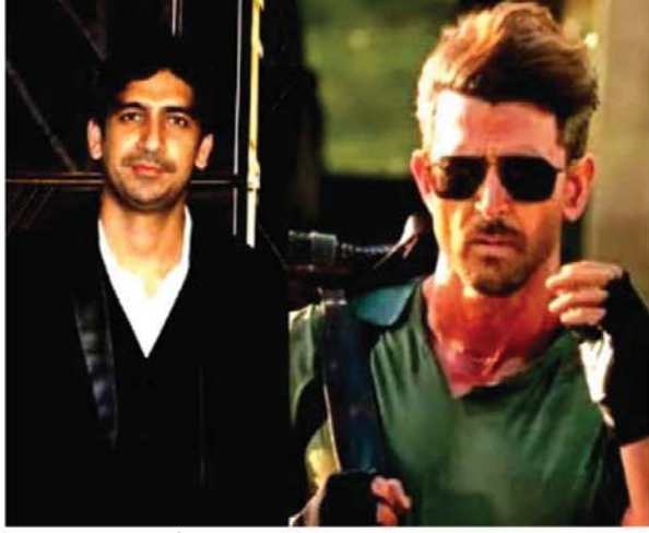
नब्ब पकड़ने में माहिर हैं। वह साबित कर चुके हैं कि बड़े स्तर पर किसी फिल्म को कैसे खड़ा करना है। इसके अलावा अयान एक युवा निर्देशक हैं, जो वॉर 2 की कहानी में नयापन ला सकते हैं। इन्होंने सब

फिल्म वॉर के ब्लॉकबस्टर होने के बाद से दर्शक इसके सीक्वल वॉर 2 की राह देख रहे थे। अब आखिरकार इसके दूसरे भाग का ऐलान हो गया है। बड़ी खबर यह है कि फिल्म के निर्देशन की कमान इस बार सिद्धार्थ आनंद के हाथ में नहीं, बल्कि यह जिम्मेदारी अयान मुखर्जी को दी गई है। ऋतिक रोशन एक बार फिर पदों पर धमाका करने के लिए तैयार हैं। आइए जानते हैं क्या कुछ जानकारी मिली है। फिल्म समीक्षक तरण आदर्श ने ट्वीट किया, अयान मुखर्जी करेंगे वॉर 2 का निर्देशन। बतौर लीड हीरो ऋतिक रोशन की मौजूदगी पक्की। वॉर 2 के लिए आदित्य चोपड़ा ने अयान को चुना है। यह यशराज फिल्मस के स्पाई यूनिवर्स की 7वीं फिल्म होगी। टाइगर 3 में जो कुछ भी घटेगा, उसकी आगे की कहानी इसमें दिखाई जाएगी। सोशल मीडिया पर कुछ लोगों को यशराज बैनर का यह फैसला भा रहा है तो कुछ इसे लेकर नाराजगी जाहिर कर रहे हैं। रिपोर्ट्स के मुताबिक, अयान ने बॉलीवुड को कई हिट फिल्में दी हैं। उनकी फिल्में हर वर्ग के दर्शकों को लुभाती हैं। अयान दर्शकों की