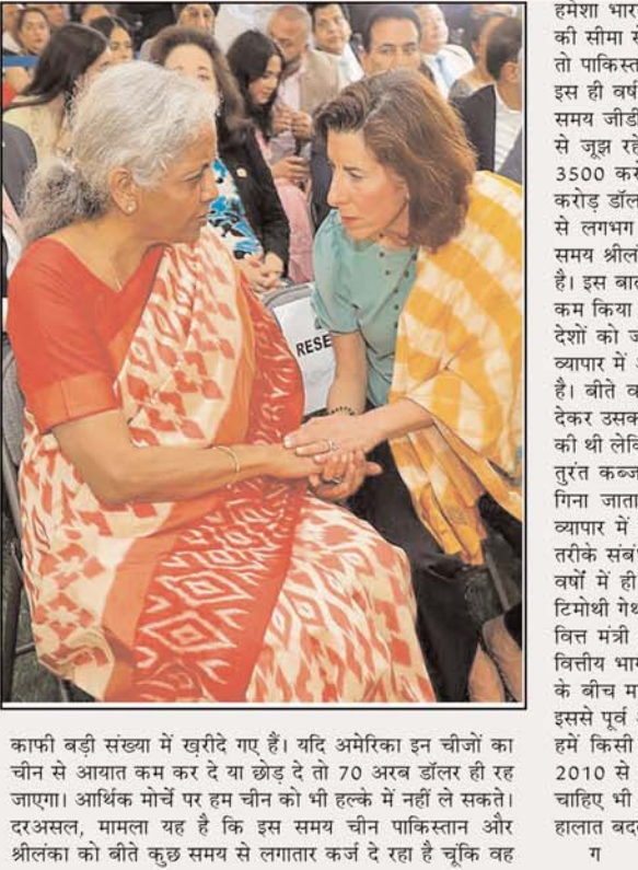
काफी बड़ी संख्या में खरीदे गए हैं। यदि अमेरिका इन चीजों का चीन से आयात कम कर दे या छोड़ दे तो 70 अरब डॉलर ही रह जाएगा। आर्थिक मोर्चे पर हम चीन को भी हल्के में नहीं ले सकते। दरअसल, मानना यह है कि इस समय चीन पाकिस्तान और श्रीलंका को बीते कुछ समय से लगातार कर्ज दे रहा है चूंकि वह