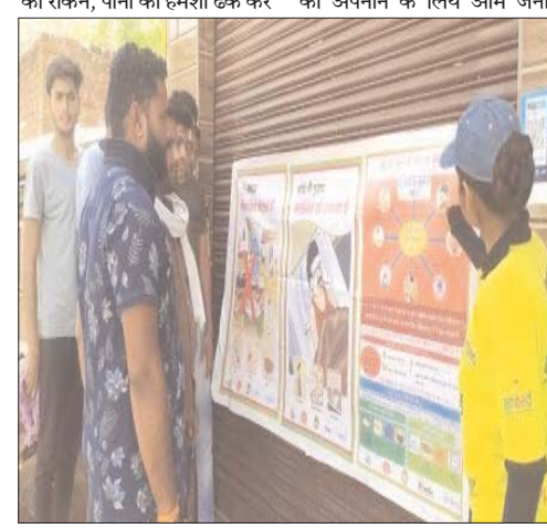
आसपास अनावश्यक जल भराव को रोकने, पानी को हमेशा ढक कर रखने, व पानी के बर्तनों मटका, टंकी, कूलर आदि की हर चौथे दिन सलाह दी गई कि बुखार में