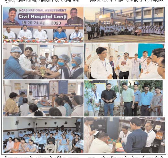
वितरण, एक्स-रे, ऑक्सलरी सर्विस, जनरल तहत प्रत्येक विभाग के नोडल नियुक्त किये