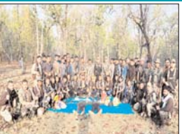
हॉक फोर्स मध्य प्रदेश को मिली एक और बड़ी सफलता मिली है। 22 अप्रैल की सुबह तड़के गढ़ी थाना अंतर्गत कदला के जंगल में हॉक फोर्स के साथ नक्सलियों की मुठभेड़ हुई है जवानों ने बहादुरी के साथ लड़ते हुए 02 महिला नक्सली को मार गिराया

गवालियर। बालाघाट पुलिस को बड़ी सफलता, 14 लाख के इनामी 2 महिला नक्सली को किया ढेर। हॉक फोर्स मध्य प्रदेश को मिली एक और बड़ी सफलता मिली है। 22 अप्रैल की सुबह तड़के गढ़ी थाना अंतर्गत कदला के जंगल में हॉक फोर्स के साथ नक्सलियों की मुठभेड़ हुई है जवानों ने बहादुरी के साथ लड़ते हुए 02 महिला नक्सली को मार गिराया।