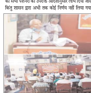
है इसी संदर्भ में 21 मार्च 23 को नर्मदा पुरम में साधारण सभा की बैठक में सभी पेंशनरों को महंगाई राहत के एरियर के भुगतान बाबत रिट दायर करने का निर्णय लिया गया,