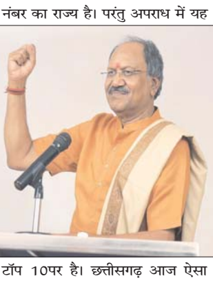
नंबर का राज्य है। परंतु अपराध में यह टॉप 10 पर है। छत्तीसगढ़ आज ऐसा