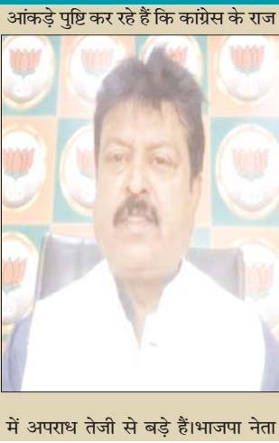
आंकड़े पुष्टि कर रहे हैं कि कांग्रेस के राज में अपराध तेजी से बढ़े हैं। भाजपा नेता