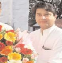
नाम पर चुनाव लड़ा था, लेकिन जब मुख्यमंत्री बनने की घड़ी आई तो उस समय बुजुर्ग नेता कमलनाथ को आगे कर दिया। मुख्यमंत्री शिवराज सिंह चौहान ने जो भाव प्रकट किए

सिंह चौहान की एंट्री हो गई तो इसके सियासी मायने ही बदल गए। मुख्यमंत्री शिवराज सिंह चौहान ने बयान दिया कि साल 2018 में कांग्रेस ने ज्योतिरादित्य सिंधिया के जानकार मानते हैं कि मुख्यमंत्री शिवराज सिंह चौहान भी साल 2018 में हुई बीजेपी की हार के लिए ज्योतिरादित्य सिंधिया को ही जिम्मेदार मानते हैं। मतलब साफ है कि ज्योतिरादित्य सिंधिया के कारण मध्य प्रदेश में कांग्रेस की सरकार बनी। हालांकि, सिंधिया के बीजेपी में शामिल होने के बाद अब मामा (शिवराज सिंह चौहान) और महाराज (ज्योतिरादित्य सिंधिया) एक साथ मिलकर कांग्रेस के राजा (दिग्विजय सिंह) का सीधा और कड़ा मुकाबला करेंगे। बीजेपी ने जारी किया था यह पोस्टर-साल 2018 के चुनाव में बीजेपी ने भी ज्योतिरादित्य सिंधिया को सत्ता की राह में सबसे बड़ा रोड़ा मानते हुए उनके खिलाफ पोस्टर तैयार कर दिए थे। इस पोस्टर में लिखा गया था कि माफ करो महाराज, हमारे नेता शिवराज। हालांकि, बीजेपी में ज्योतिरादित्य सिंधिया की एंट्री के बाद मामा और महाराज एक साथ बीजेपी के पक्ष में आवाज बुलंद कर रहे हैं। जब दिग्विजय सिंह केंद्रीय मंत्री ज्योतिरादित्य सिंधिया को लेकर बयान दिया तो एक बार फिर मुख्यमंत्री शिवराज सिंह चौहान के बयान पुरानी यादों को ताजा कर दिया।