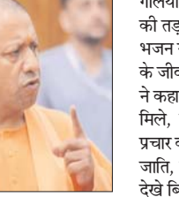
जोड़ने के लिए हो रहा है जिसमें नगर निगमों के महापौर, पापंद, नगर पालिका और नगर पंचायतों के अध्यक्षों और सभासदों को कमल निशान पर मत देकर चुनाव जिताना है और जब बहुमत का उनका बोर्ड बनना तो दिल्ली से जो पैसा आएगा उसका सदुपयोग होगा। उन्होंने कहा,

हमें तय करना है कि हमें 2017 के पहले की जातिवादी सरकारों चाहिए या फिर गरीब कल्याण के लिए समर्पित सरकार चाहिए। योगी ने कहा कि हमें तय करना होगा कि युवाओं के हथ में तमचे हों या युवाओं के हथ में टैबलेट और स्मार्टफोन हों। हमें तय करना है कि गलियों में अपराधियों की गोलियों की तड़तड़हट होनी चाहिए या फिर भजन गंगा का प्रवाह सुनाकर लोगों के जीवन में परिवर्तन। आदित्यनाथ ने कहा, मां शाकंभरी का आशीर्वाद मिले, मैं इसलिए यहां से चुनाव प्रचार की शुरुआत कर रहा हूँ, हमने जाति, मजहब या किसी का चेहरा देखे बिना सभी तक योजनाओं का लाभ पहुंचाया। उन्होंने कहा कि प्रधानमंत्री नरेंद्र मोदी के नेतृत्व में सहारनपुर विकास की एक नई आभा के साथ देश और दुनिया के सामने चमकता हुआ दिखाई दे रहा है। उन्होंने सहारनपुर के लिए विकास योजनाओं को भी विस्तार से बताया।