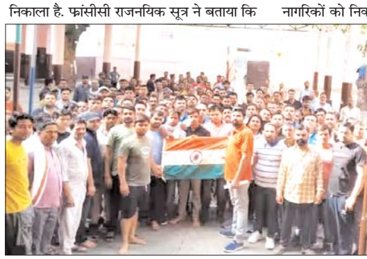
फ्रांस की वायु सेना ने अब तक पांच भारतीय भारतीयों को इस अफ्रीकी देश से सुरक्षित रूप से

नई दिल्ली। अफ्रीकी देश सूडान में फंसे भारतीय नागरिकों को वापस लाने के लिए सरकार ऑपरेशन कावेरी चला रही है। जिसके तहत 500 भारतीय पोर्ट सूडान पहुंच गए हैं। इस बारे में सोमवार (24 अप्रैल) को विदेश मंत्री डॉ. एस जयशंकर ने ट्वीट कर जानकारी दी। उन्होंने लिखा कि सूडान में फंसे हमारे नागरिकों को वापस लाने के लिए ऑपरेशन कावेरी चल रहा है। लगभग 500 भारतीय पोर्ट सूडान पहुंच गए हैं जबकि अन्य रास्ते में हैं। विदेश मंत्री एस जयशंकर ने आगे लिखा कि हम सूडान में अपने नागरिकों की सहायता करने के लिए प्रतिबद्ध हैं। हमारे विमान और शिप उन्हें वापस लाने के लिए तैयार हैं। वहीं फ्रांस ने हिंसाग्रस्त सूडान से निकासी अभियान के तहत 5 भारतीय नागरिकों सहित 28 देशों के नागरिकों को बाहर निकाला है। फ्रांसीसी राजनयिक सूत्र ने बताया कि नागरिकों को निकाला है। इन भारतीयों को 28 से अधिक अन्य देशों के लोगों के साथ जिबूती में फ्रांस के सैन्य अड्डे पर लाया गया। इससे पहले रविवार को सऊदी अरब ने कहा था कि उसने घनिष्ठ संबंध रखने वाले देशों और मित्र राष्ट्रों के 66 नागरिकों को सूडान से सुरक्षित रूप से निकाला है, जिनमें कुछ भारतीय भी शामिल हैं। इससे पहले रविवार को भारत के विदेश मंत्रालय ने कहा था कि भारत ने हिंसा प्रभावित सूडान में फंसे भारतीयों को इस अफ्रीकी देश से सुरक्षित रूप से