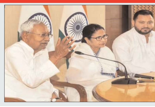
कोई एतराज नहीं है। बीजेपी बहुत बड़ी हीरो बन गई है अब उसको जीरो बनाना है। हम साथ-साथ आगे बढ़ेंगे। हमारा कोई व्यक्तिगत अहंकार नहीं है, हम साथ मिलकर काम करना चाहते हैं। नीतीश कुमार ने कहा कि जो सत्ता में है वो सिर्फ अपनी चर्चा करते हैं और कुछ नहीं, ये आजादी की लड़ाई है, हम अलर्ट रहना है। ये लोग इतिहास बदल रहे हैं। अब पता

नई दिल्ली। लोकसभा चुनाव से पहले सभी विपक्षी दलों को एक करने में जुटे बिहार के मुख्यमंत्री नीतीश कुमार ने सोमवार (24 अप्रैल) को कोलकाता में पश्चिम बंगाल की मुख्यमंत्री ममता बनर्जी से मुलाकात की। बिहार के डिप्टी सीएम तेजस्वी यादव भी इस बैठक में मौजूद रहे। इस बैठक के बाद ममता बनर्जी ने कहा कि मैंने नीतीश जी से यही अनुरोध किया है कि जयप्रकाश जी का आंदोलन बिहार से हुआ था तो हम भी बिहार में ऑल पार्टी मीटिंग करें। हमें एक संदेश देना है कि हम सभी एक साथ हैं। उन्होंने कहा कि अगर विजय और मिशन साफ है तो हम साथ में लड़ेंगे, ये तय है। किस आधार पर होगा ये समय पर तय होगा। मैंने तो पहले ही कह दिया है कि मुझे इससे