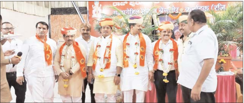
परिसर में शनिवार को संत खेतेश्वर महाराज का 111 खेतेश्वर महाराज की तस्वीर के समक्ष दीप प्रज्वलित

पुष्पांजली टुडे बंगलूरु। मसूर रोड स्थित राजपुरोहित समाज भवन वां जन्मोत्सव धूम-धाम से मनाया। भवन में रात्री भजन संध्या का आयोजन किया गया। भवन में