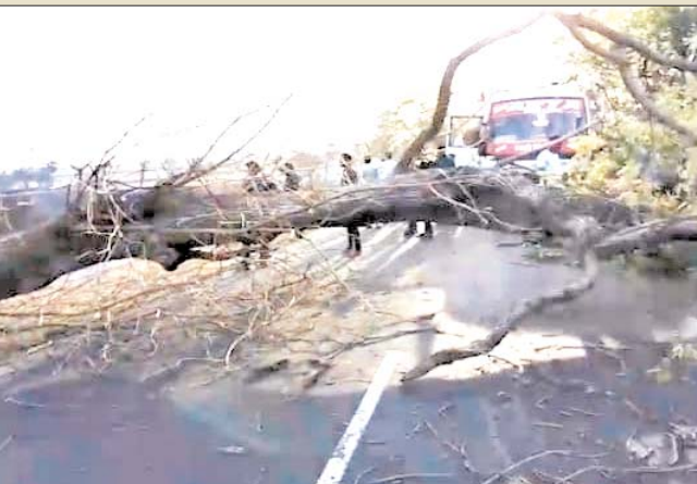
रविवार शाम सड़क किनारे लगी आग की के दोनों ओर वाहनों का जाम लग गया। मार्ग

खरगोन जिले से मुन्ना खान पुष्पांजली टुडे खरगोन। जिले के खंडवा-खरगोन मार्ग पर चपेट में आने से एक सूखा पेड़ जल गया। जिसका एक भाग जलते हुए बीच रोड पर जा गिरा। रोड के बीचो-बीच पेड़ गिरने से मार्ग