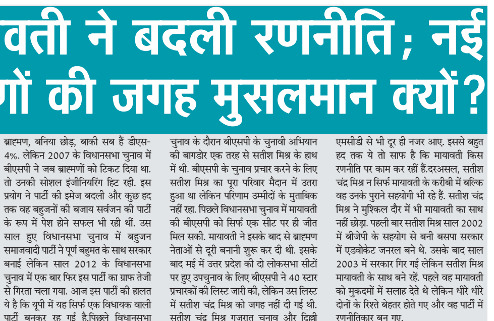
एमसीडी से भी दूर ही नजर आए। इससे बहुत हद तक ये तो साफ है कि मायावती किस रणनीति पर काम कर रही हैं। दरअसल, सतीश चंद्र मिश्र ने सफाई मायावती के करीबी में बल्कि वह उनके पुराने सहयोगी भी रहे हैं। सतीश चंद्र मिश्र ने मुश्किल दौर में भी मायावती का साथ नहीं छोड़ा। पहली बार सतीश मिश्र साल 2002 में बीजेपी के सहयोग से बनी बसपा सरकार में एडवोकेट जनरल बने थे। उसके बाद साल 2003 में सरकार गिर गई लेकिन सतीश मिश्र मायावती के साथ बने रहे। पहले वह मायावती को मुकदमों में सलाह देते थे लेकिन धीरे धीरे दोनों के रिश्ते बेहतर होते गए और वह पार्टी में रणनीतिकार बन गए।