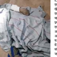
युवक का शव परिवार के सदस्यों के साथ अंतिम संस्कार के लिए लाया जा रहा है।