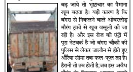
मौरंग के बिल्डिंग अडवाउट अडवाउट के निरीक्षण के दौरान पुलिस द्वारा ट्रकों की वसूली की जा रही है।

इमरानवर योगी के भ्रष्ट तुम्हारे सरकार को चौकलदार बनाने में कहां करण नहीं छोड़ रहे हैं। जैसे तो साफ़ाडू डेज का संग्रह कार्गो समग्र से अशेष रूप से मौरंग ट्रकों के निरक्षण का हब बना चुका है, लेकिन इन डेज वाले धर्मों में पुलिस की सहिताना बंदूक जारें तो भूखाना का पैमाना खूब बढ़ता है।