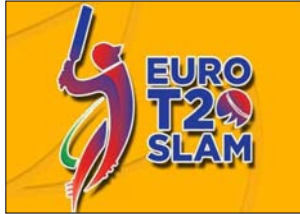
जैसे खिलाड़ी शामिल होने जा रहे थे। आयोजकों ने कहा कि आयोजन को उम्मीद है कि यह

लंदन । कोरोना वायरस महामारी को देखते हुए अब यूरो टी-20 स्लैम क्रिकेट टूर्नामेंट को स्थगित कर दिया गया है। इस टूर्नामेंट में आयरलैंड, स्कॉटलैंड और हॉलैंड को छह फं चाइजी भाग लेती हैं। आयोजकों ने कहा कि इस टूर्नामेंट को पहले 2019 में शुरू किया जाना था पर अब इसे स्थगित कर दिया गया है। इस टूर्नामेंट में न्यूजीलैंड के माटिन गुस्तिन, इंग्लैंड के विश्वकप विजेता कप्तान इयोन मॉर्गन और पाकिस्तान के शारिफ अफरोदी