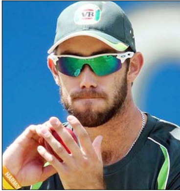
समय के लिए ब्रेक भी लिया था। लाम उठया और इससे में शारीरिक व मानसिक रूप से तरताजा हो रहे हैं। उन्होंने कहा, "कोरोन काल के समय घर पर रहने का मैंने पूरा

मैक्सवेल । ऑस्ट्रेलियाई ऑलराउंडर ग्लेन मैक्सवेल ने इंडियन प्रीमियर लीग (आईपीएल) को तरीफ करते हुए कहा कि यह एक प्रकार से छोटा विश्वकप ही है। मैक्सवेल के अनुसार आईपीएल में दुनिया भर के खिलाड़ियों को प्रतिस्पर्धा का अच्छा अवसर मिलता है। इसमें शामिल खिलाड़ियों को एक दूसरे से कड़ी टकरा मिलती है जिससे उनका खेल बेहतर होता है। मैक्सवेल ने कहा, "आपने आईपीएल पर संभवतः का इंजागर करना होगा कि यात्रा और पृथक्वास समय और अन्य चीजों के बारे में आप क्या कर सकते हो और क्या नहीं। अगर सबकुछ सही रहता है तो इसमें भाग नहीं लेने का कोई कारण नहीं बचता है। उन्होंने कहा, "विदेशी खिलाड़ियों को इंडियन खेलकर कामी रोमांच का अनुभव होता है इसमें विश्व कप की तरह दुनिया के कुछ सर्वश्रेष्ठ खिलाड़ी मुकाबला करते हैं। मैक्सवेल को इंग्लैंड दौरे के लिए ऑस्ट्रेलियाई टीम 26 सप्टेंबर टीम में शामिल किया गया है। इस 31 वीं वीर खिलाड़ी ने पिछले साल मानसिक स्वास्थ्य और थकान का मामला उठाते हुए कुछ