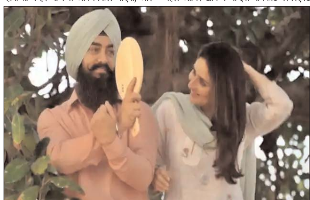
रिस्पॉन्स अच्छा होगा। मुझे लगता है कि अच्छी फिल्म में हर चीज से पार पा लेती हैं। याद दिला दें कि सिर्फ लाल सिंह चड्ढा ही नहीं करीना के कुछ पुराने बयानों के चलते उनको बायकॉट करने के

मुंबई। बॉलीवुड अभिनेता आमिर खान की अपकमिंग फिल्म लाल सिंह चड्ढा की रिलीज में कुछ ही दिन रह गए हैं। फिल्म में आमिर खान के साथ ही करीना कपूर खान चैतन्य अकिनेनी और मोना सिंह भी अहम किरदारों में नजर आएंगी। फिल्म की रिलीज से पहले सितारे प्रमोशन के लिए मैदान में उतर गए हैं और हर मुद्दे पर बात कर रहे हैं। हाल ही में आमिर खान ने लाल सिंह चड्ढा के बायकॉट पर रिएक्ट किया था, इसके बाद अब करीना ने भी इस पर अपनी राय रखी। लाल सिंह चड्ढा के बायकॉट पर क्या बोलीं करीना-आमिर खान के बाद फिल्म लाल सिंह चड्ढा के बायकॉट पर करीना कपूर खान ने भी रिएक्ट किया है। करीना ने इंडिया टुडे से बातचीत में कहा, आज हर कोई बोलने का हक रखता है, आज ढेर सारे प्लेटफॉर्मस मौजूद हैं, हर किसी के अपने विचार हैं। तो अगर ऐसा होगा तो आपको कुछ चीजें इनोवर करना सीखना होगा। वरना आपको अपनी जिंदगी जीना मुश्किल हो जाएगा। इसलिए मैं ऐसी चीजों को सॉरियसली नहीं लेती हूँ। मैं वो पोस्ट करती हूँ, जो मैं करना चाहती हूँ। ये एक फिल्म है, जो रिलीज होने वाली है- करीना कपूर खान ने आगे कहा, ५० एक फिल्म