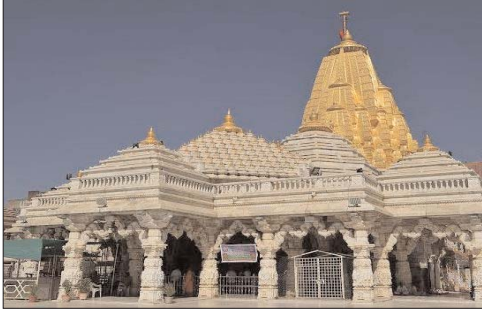
प्रस्तुत किया गया विवाह आमंत्रण पत्रिका स्वीकार किया जाएगा। अंबाजी मंदिर में दर्ज की जाएगी। जगदंबा के पावन अवसर के रूप में

द्वारा व्यक्तिगत रूप से माताजी को व्यक्तिगत रूप से दी गई कंकोत्री अंबाजी ट्रस्ट तीर्थयात्रियों को माताजी का आशीर्वाद प्राप्त करने के लिए शुभेच्छा किट प्रदान करेगा। इस किट में कंकू, रक्षा पोतली, प्रसाद, माताजी द्वारा नवविवाहितों को आशीर्वाद स्वरूप माताजी को चढ़ाया गया स्मृति चिन्ह शामिल होगा। जगदंबा जगदंबा भक्तों के शुभ अवसर पर देवस्थान ट्रस्ट द्वारा सुख-समृद्धि और धन-संपत्ति की कामना की जाएगी। श्री अरसुरी अंबाजी माता देवस्थान ट्रस्ट की प्रेस विज्ञप्ति में कहा गया है कि यह शुभेच्छा किट 1-5-2023 से माई भक्तों को माताजी के आशीर्वाद के रूप में उपलब्ध होगी।