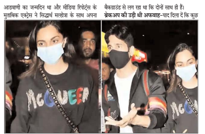
आडवाणी का जन्मदिन था और मीडिया रिपोर्ट्स के मुताबिक एक्ट्रेस ने सिद्धार्थ मल्होत्रा के साथ अपना बर्थडे सेलिब्रेशन से लग रहा था कि दोनों साथ ही हैं। ब्रेकअप की उड़ी थी अफवाह-याद दिला दें कि कुछ समय पहले ऐसी खबरें थीं कि सिद्धार्थ और कियारा ने अपने रास्ते अलग कर लिए हैं लेकिन जल्द ही वो साथ में सार्वजनिक रूप से दिखे। पार्टी से लेकर फिल्म स्क्रीनिंग तक से सिद्धार्थ और कियारा के वीडियोज वायरल हुए।