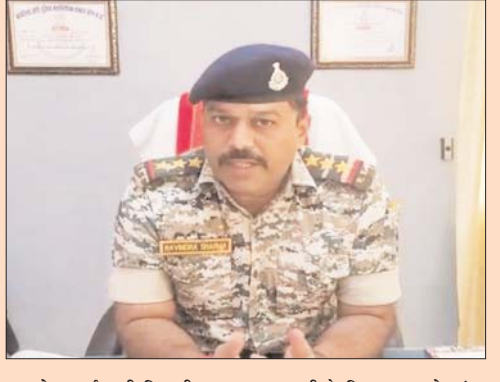
पर सभी के विरुद्ध थाना मेहगांव में अपराध क्रमांक 367/ 21 धारा 420 ,294 ,506 419,