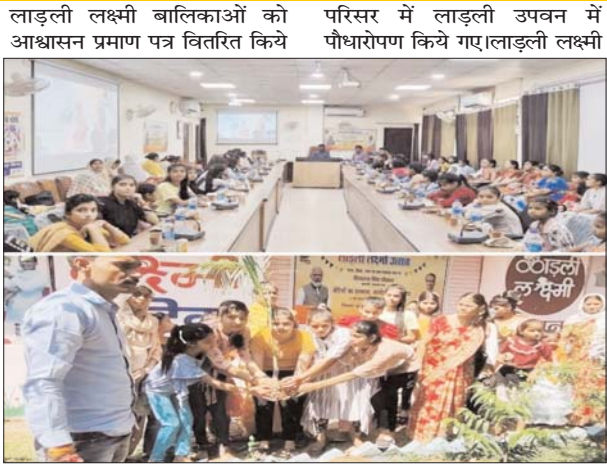
लाइली लक्ष्मी बालिकाओं को परिसर में लाइली उत्सव में आश्वासन प्रमाण पत्र वितरित किये पौधारोपण किये गए। लाइली लक्ष्मी