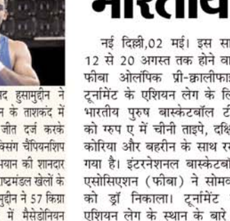
मेजबान फ्रांस सहित कुल 12 टीमों शामिल होंगी। फीबा बास्केटबॉल विश्व कप 2023, जो इस साल अगस्त और सितंबर में फिलीपींस, जापान और इंडोनेशिया द्वारा सह-मेजबानी की जाएगी, इनमें से सात टीमों के भाग्य का फैसला करेगा। दो चरण के फीबा ओलंपिक योग्यता टूर्नामेंट चार अंतिम स्थान निर्धारित करेंगे। अंतिम साल, दूसरा क्वालीफाइंग चरण एक वैश्विक प्रतियोगिता होगी जबकि पहला प्री-क्वलीफाइंग चरण महाद्वीपीय स्तर पर खेला जाएगा। कुल 40 टीमों जो फीबा

बास्केटबॉल विश्व कप 2023 के लिए क्वालीफाई करने में विफल रहें, उन्हें प्री-क्वलीफाइंग टूर्नामेंट के माध्यम से पेरिस 2024 में जगह बनाने का दूसरा मौका मिलेगा। फीबा बास्केटबॉल विश्व कप 2023 के लिए एशियाई क्वालीफायर के दूसरे दौर में आगे बढ़ने के बाद, भारत को सूची में जोड़ा गया। पांच टीमों, यूरोप से दो और एशिया, अफ्रीका और अमेरिका से एक-एक, प्री-क्वलीफाइंग खेलों में भाग लेने वाली 40 टीमों से 2024 के अंतिम ओलंपिक क्वालीफाइंग इवेंट में आगे बढ़ेंगे।