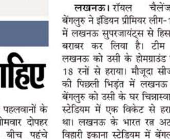
लखनऊ। रॉयल चैलेंजर्स वेंगलुरु ने इंडियन प्रीमियर लीग-16 में लखनऊ सुपरजायंट्स से हिसाब बराबर कर लिया है। टीम ने लखनऊ को उसी के होमग्राउंड पर 18 रनों से हराया। मौजूदा सीजन की पिछली भिड़त में लखनऊ ने वेंगलुरु को उसी के घर चिन्नास्वामी स्टेडियम में एक विकेट से हराया था। लखनऊ के भारत रत्न अटल बिहारी वाजपेयी इकाना क्रिकेट स्टेडियम में सुधार करते हुए 20 ओवर में 9 विकेट पर 126 रन बनाए। जवाब में लखनऊ की टीम 19.5 ओवर में 108 रन पर आउट हो गई। वेंगलुरु ने इस सीजन सबसे छोटा स्कोर डिफेंड किया है। इससे पहले सबसे छोटा स्कोर डिफेंड करने का रिकॉर्ड गुजरात के नाम था। गुजरात टाइटंस ने 22 अप्रैल को लखनऊ के ही