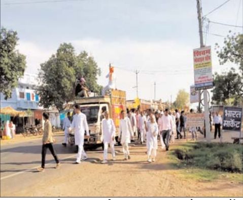
मालनपुर। प्रजापिता ब्रह्माकुमारी ईश्वरीय विश्वविद्यालय मालनपुर महाराजपुरा आश्रम में तीन दिवसीय समर्पण समारोह समर्पण महोत्सव में गोल्डन वन रिट्रीट सेंटर महाराजपुरा

मालनपुर आश्रम से भारत मार्केट पेट्रोल पंप तक शिव स्वरूप की झांकी निकालकर शिव बारात निकाली गई जिसमें भक्तों के द्वारा विशाल समूह के साथ बाबा