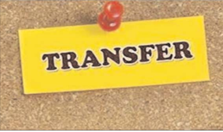
अनुविभागीय अधिकारी, तहसीलदार, नायब भूमिका महत्वपूर्ण रहेगी। सूची का कार्य प्रभावित न

का काम होगा। इसमें कलेक्टर, कमिश्नर, तहसीलदार और 64,100 बूथ लेवल आफिसर की