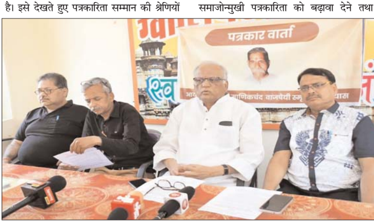
की संख्या 14 की गई है। यहां बता दें कि पिछले 17 वर्षों से नारद जयंती पर जनकल्याणकारी, पत्रकारिता के क्षेत्र में ऐसी श्रेष्ठ जीवनशैली को अंगीकार करने वाले पत्रकारों को सम्मानित करने