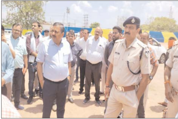
सभी विभाग खासकर शिक्षा, जनपद, स्वास्थ्य सीएम हेल्पलाइन पर की गई