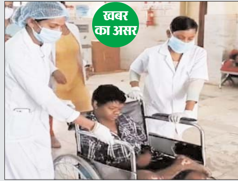
खबर का असर

दंग से नहीं पाया। इसके अलावा बचपन से उसे मिर्गी के झटके आते हैं।