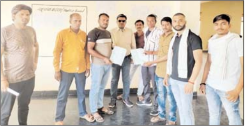
कपूर्ी ठक्कर जी के आदर्शों पर चलते हुए अपना कार्य पूर्ण ईमानदारी से करते हुए