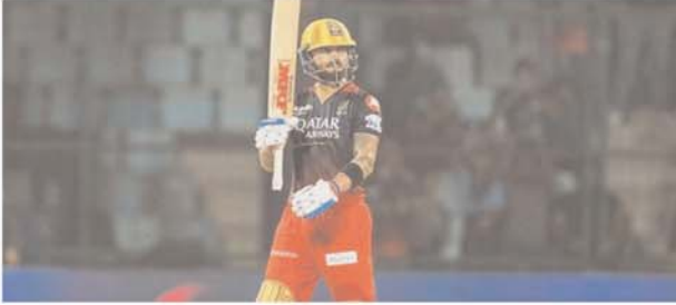
मैं अपनी टीम के लिए जो करने की कोशिश कर रहा हूँ उस यात्रा के दौरान 7000 रन सिर्फ एक और उपलब्धि है। जब आप अपनी टीम के लिए कुछ करने की कोशिश करते हैं तो यह एक अच्छा नंबर होता है। कोहली ने 2008 में आईपीएल की शुरुआत के बाद अपने 233वें मैच में यह उपलब्धि हासिल की। इस मैच से पहले उनके नाम 6,988 रन थे। कोहली ने

नयी दिल्ली। विराट कोहली शनिवार को आईपीएल (इंडियन प्रीमियर लीग) इतिहास में 7000 रन बनाने वाले पहले खिलाड़ी बन गए, लेकिन इस सुपरस्टार बल्लेबाज के लिए यह उनके शानदार करियर की 'एक और' उपलब्धि भर ही है। कोहली ने इस उपलब्धि को हासिल करने के बाद कहा कि वह विनम्रता के साथ कड़ी मेहनत करना जारी रखना चाहते हैं। कोहली ने यहां फिरोजशाह कोटला मैदान में सत्र का अपना छठा अर्धशतक लगाया। उनकी 46 गेंदों में 55 रन की पारी से रॉयल चैलेंजर्स बेंगलूर ने दिल्ली कैपिटल्स के खिलाफ चार विकेट पर 181 रन बनाये। इस मैदान से क्रिकेट की अपनी यात्रा शुरू करने वाले कोहली ने आईपीएल प्रसारकों से कहा,