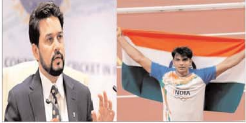
खिताब अपने नाम किया। चोपड़ा का पहला थ्रो 88.67 था जो नए सीजन की शुरुआत करने का एक शानदार तरीका था। उनका पहला थ्रो उनके लिए जीत पक्की करने के लिए काफी था लेकिन उन्होंने फिर भी आगे बढ़ने की कोशिश की। चोपड़ा का दूसरा थ्रो 86.04

नई दिल्ली। टोक्यो ओलंपिक स्वर्ण पदक विजेता नीरज चोपड़ा के दोहा डायमंड लीग 2023 जीतने पर केंद्रीय युवा मामलों और खेल मंत्री अनुराग ठाकुर ने नीरज चोपड़ा को बधाई दी है। अनुराग ठाकुर ने एक ट्वीट में कहा, नीरज चोपड़ा जीत गए! 88.67 मीटर के जोरदार थ्रो के साथ, उन्होंने दोहा डायमंड लीग में अपना दबदबा बनाया और गौरव घर लाये। एक सच्चा चैंपियन जिसने देश को फिर से गौरवान्वित किया है। इस शानदार जीत के लिए बधाई नीरज! नीरज चोपड़ा ने चोट से उबरने के बाद शानदार वापसी करते हुए 88.67 मीटर थ्रो के साथ दोहा डायमंड लीग 2023 का