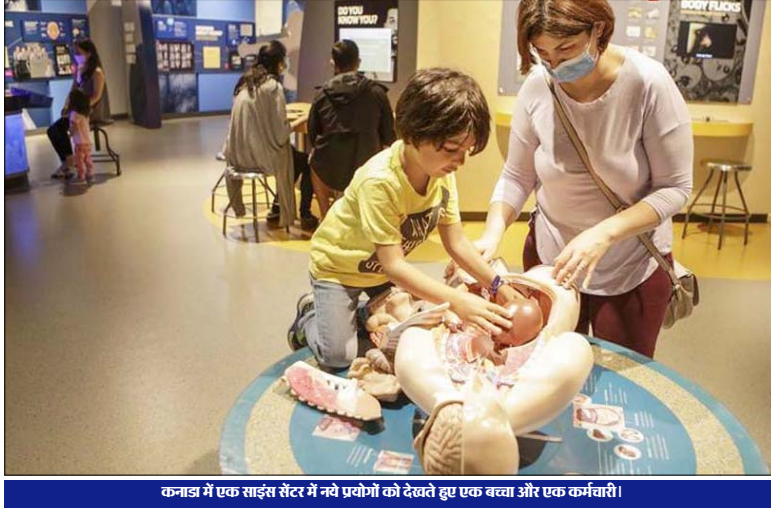
कनाडा में एक साइंस सेंटर में नये प्रयोगों को देखते हुए एक बच्चा और एक कर्मचारी।