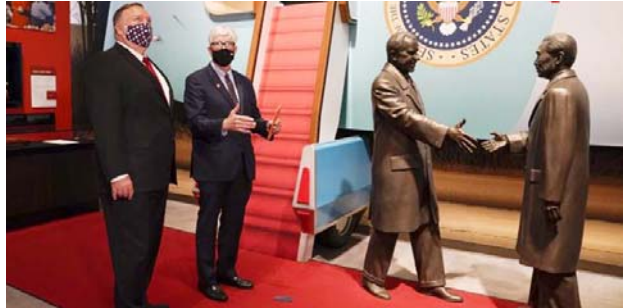
लंडन में अमेरिकी विदेश मंत्री माइक पोम्पेो निरान फाउंडेशन के प्रेसिडेंट के साथ प्रेसीडेंशियल लाइब्रेरी पहुंचे।

से अलग हो कर बने 'द इस्लामिक स्टेट वेस्ट अफ्रीका प्रविंस' ने जून में चेतावनी दी थी कि वह अंतर्राष्ट्रीय सहायता समूहों की सेना को मदद करने वाले नाइजीरियाई लोगों को निशाना बनाएगा। नाइजीरिया के राष्ट्रपति सहायताकर्मियों की हत्या के लिए पहले ही कट्टरपंथियों को जिम्मेदार ठहरा चुके हैं। कट्टरपंथी संगठनों पर नजर रखने वाले खुफिया समूह एसआईडी के अनुसार संगठन ने सहायता कर्मियों की हत्या की जिम्मेदारी ली है। एसआईडी के अनुसार इन सहायताकर्मियों की हत्या रिव्बर की गई और इसके बाद हत्या को वीडियो सोशल मीडिया पर डाला गया। इस घटना