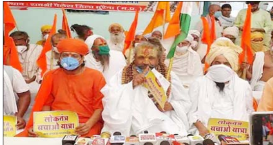
कंप्यूटर बाबा की कर्मलनाथ के पक्ष में यात्रा रहेगी

भोपाल। पूर्व कैबिनेट मंत्री का दर्जा प्राप्त कम्प्यूटर बाबा उपचुनाव के सियासी मैदान में उतर गए हैं। उन्होंने लोकतंत्र बचाओ यात्रा शुरू कर दी है। उनकी यह यात्रा खालियर से निकाली गई, जो उन सभी विधानसभा सीटों पर जायेगी, जहाँ चुनाव होना है। उन्होंने कहा कि उप चुनाव में बीजेपी की सरकार को उखाड़ फेंकने लिए जनता के बीच जाएंगे। जनता की सरकारों के बारे में बताया जाएगा कि किस सरकार ने कैसा काम किया और बीजेपी सरकार अब क्या कर रही है। उसने किस तरीके से खरीद-फरोख्त के जरिए विधायकों को अपने पाले में किया और लोकतंत्र की हत्या की।