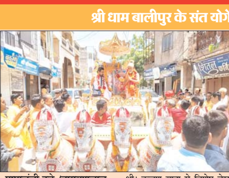
पुष्पांजली टुडे /नारायणलाल सणघा