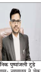
दैनिक पुष्पांजली टुडे ग्वालियर- न्यायालय ने चेक