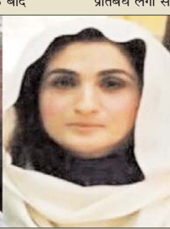
पाकिस्तान सेना पीटीआई पर भी जल्द ही