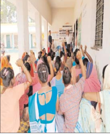
पर प्रयास करेंगे और एक एक गांव सहित पूरे पंचायत

अपने गांव को बाल विवाह मुक्त करने हेतु सामूहिक स्तर