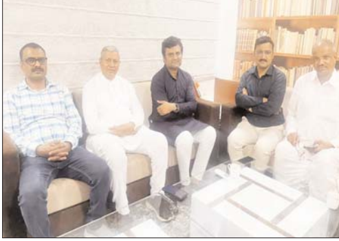
भी प्रवासी सामाजिक बंधु अपने बच्चों का एडमिशन करवाते हैं उन्हें विशेष