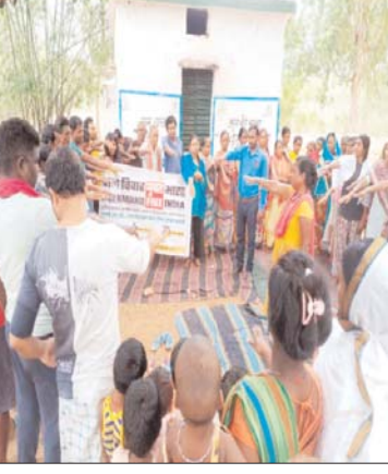
इसी कड़ी में मुख्य अतिथि विद्यालय के