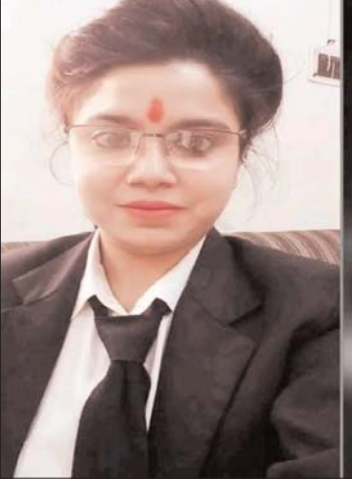
आगे बताते हैं कि निज ग्राम से रामगढ़ स्थित एन

आम आदमियों को खान की समस्या हो गई है। वे