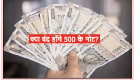
क्या बंद होंगे 500 के नोट?

क्या 2000 के बाद अब 500 के नोट भी होंगे वापस?