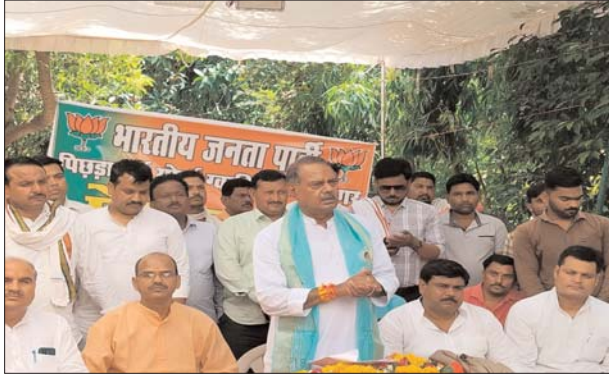
कहा कि पार्टी ने उन्हें पापंद से लेकर विधायक तथा मंत्री बनाया। वह तो साधारण से किसान थे। पार्टी ने उन्हें बहुत कुछ दिया है अब भगवान

अटल बिहारी वाजपेयी के भांजे हैं भी दावेदारी ठेक रहे हैं यदि पार्टी उन्हें टिकट देती है तो वह अनूप मिश्रा के पक्ष में चुनाव प्रचार करेंगे। उन्होंने