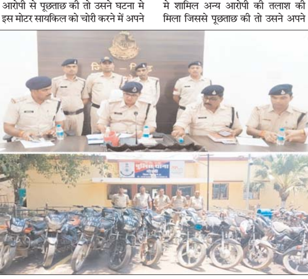
साथ अन्य साथी का नाम बताया तथा घटना में शामिल होना बताया बाद पूछताछ घटना