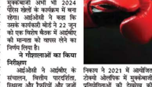
आईओसी ने अंतरराष्ट्रीय मुक्केबाजी संघ के ओलंपिक दर्जे को खत्म करने का किया फैसला