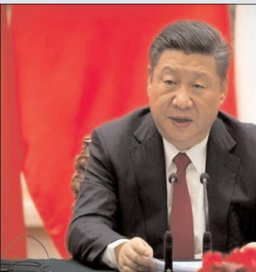
डेलवाने के चीनी के इरादों पर बी पानी फिर सकता है... पिछले कुछ सालों में रूस के साथ चीन की दोस्ती काफी ज्यादा बढ़ गई है और यूक्रेन युद्ध में तो चीन ने खुलकर रूस का साथ दिया है...