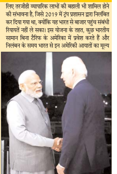
6 अरब डॉलर से अधिक था। उम्मीद है कि गुरुवार सुबह बिडेन की मोदी के साथ बैठक के बाद दोनों पक्ष कई संयुक्त पहलों और समझौतों की घोषणा करेंगे...