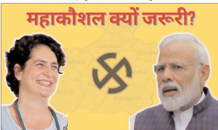
ग्वालियर-चंबल जैसे हिस्सों में बंटा हुआ है... इनमें से महाकौशल एक महत्वपूर्ण हिस्सा है भौगोलिक भी और राजनीतिक दृष्टि से भी...