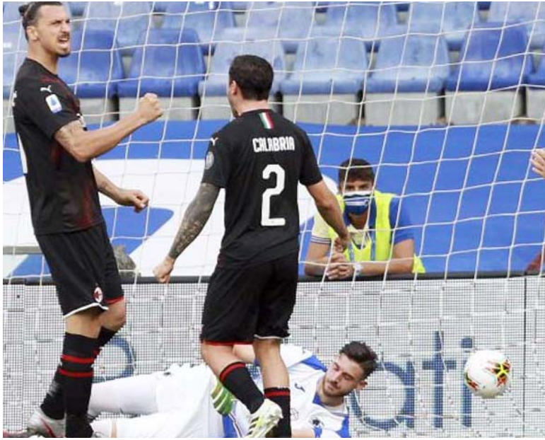
इटली के लक्ष्य जेतावा ने सेबे नए एक फूरबाल मैच में मिलान के जस्टन इन्फार्मेटिक मोल करने के बाद सुखी मनाते हुए। वह मैच फेडरेशन स्टैंडिंग में कैमराद्वारा और मिलान के बीच खेल गया था।