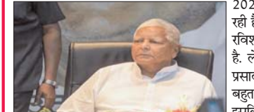
कहा था कि महागठबंधन की (2024 के चुनाव में) कम से कम 300 सीटें आएंगी. प्रधानमंत्री भ्रष्ट लोगों के संचालक हैं. अभी सभी ने देखा कि वो जिसे भ्रष्ट कहते थे, उसी को उन्होंने महाराष्ट्र में मंत्री बनाया था. उन्होंने राहुल के शादी करने को कहने के सवाल पर कहा कि देश का पीएम जो भी व्यक्ति बने उसको बिना पत्नी के नहीं रहना चाहिए

2024 में होने वाले लोकसभा चुनावों को लेकर देश की विपक्षी पार्टियां बीजेपी के खिलाफ एक संयुक्त विपक्ष महागठबंधन पर विचार कर रही हैं. आरजेडी अध्यक्ष लालू प्रसाद यादव ने दावा किया कि यह गठबंधन 300 से अधिक सीटें जीतेगा. इस पर बिहार से ही बीजेपी नेता रविशंकर प्रसाद ने पलटवार करते हुए कहा कि बीजेपी बिहार में 40 सीटें जीतेगी. रविशंकर प्रसाद ने कहा, लालू जी ने कोई नई बात नहीं कही है. लेकिन वो यह बात नहीं बता पा रहे हैं कि 2024 लोकसभा चुनाव के लिए जो बारात सज रही है उसका दूल्हा कौन है? रविशंकर प्रसाद ने कहा लालू यादव पर ताना मारते कहा कि आप चिंता नहीं करिए बिहार की सभी 40 सीटें हम ही जीतेंगे. लेकिन अभी आपको बहुत कुछ करना है. आपको चारा घोटाले में बनाई गई नई चार्जशीट पर जवाब देना है. नौकरी के बदले जमीन मामले में जवाब देना है, इसलिए उनको अभी बहुत सारे जवाब देने हैं. आरजेडी सुप्रीमो लालू प्रसाद यादव ने मीडिया से बात करते हुए गुरुवार (6 जुलाई) को कहा था कि महागठबंधन की (2024 के चुनाव में) कम से कम 300 सीटें आएंगी. प्रधानमंत्री भ्रष्ट लोगों के संचालक हैं. अभी सभी ने देखा कि वो जिसे भ्रष्ट कहते थे, उसी को उन्होंने महाराष्ट्र में मंत्री बनाया था. उन्होंने राहुल के शादी करने को कहने के सवाल पर कहा कि देश का पीएम जो भी व्यक्ति बने उसको बिना पत्नी के नहीं रहना चाहिए