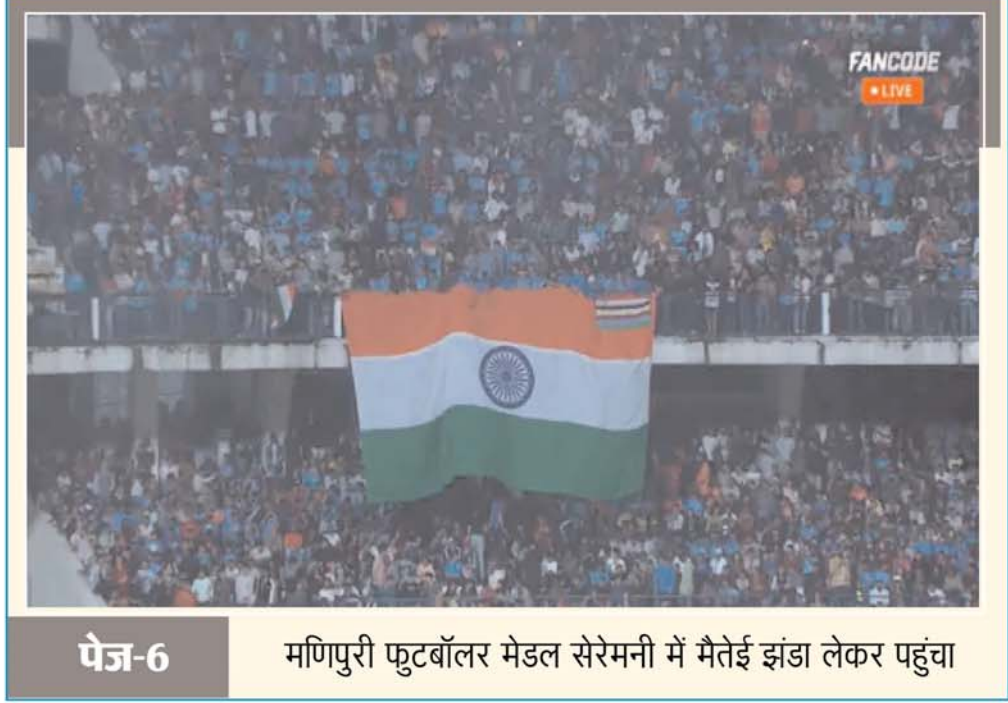
पेज-6 मणिपुरी फुटबॉलर मेडल सेरेमनी में मैतेई झंडा लेकर पहुंचा