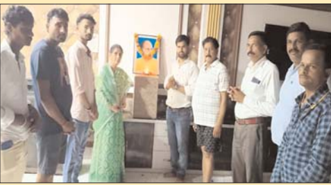
दैनिक पुष्पांजली टुडे