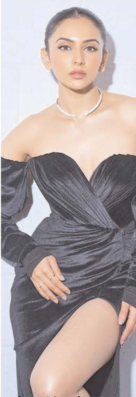
ब्लैक थाई स्लिट ड्रेस पहनकर