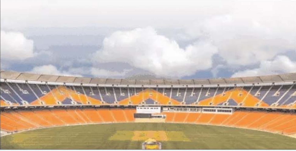
वर्ल्ड कप की सभी 10 टीमों फाइनल

क हांगझु शहर में हान जा रह एशियन गेम्स में भारत पहली बार में और विमेंस क्रिकेट टीम भेजेगा। मुस्ताक अली ट्रॉफी में इम्पैक्ट प्लेयर का नियम इन्होंने की तर्ज पर डेमोस्ट्रिक टी-20 टूर्नामेंट सैथ्यद मुस्ताक अली ट्रॉफी में इम्पैक्ट प्लेयर का नियम पूरी तरह लागू होगा। अगस्त में मीडिया एंड ब्रॉडकास्टिंग राइट्स की नीलामी बोर्ड सितंबर में ऑस्ट्रेलिया के खिलाफ वनडे सीरीज से अपने मैचों के मीडिया और ब्रॉडकास्टिंग राइट्स की नीलामी अगस्त के आखिरी सप्ताह में करेगा। अफगानिस्तान सीरीज को आगे बढ़ाया भारतीय बोर्ड ने वनडे कप के आयोजन को देखते हुए अफगानिस्तान के खिलाफ सीरीज को आगे बढ़ाया है। यह सीरीज जनवरी-2024 में होगी। यह वनडे कप से