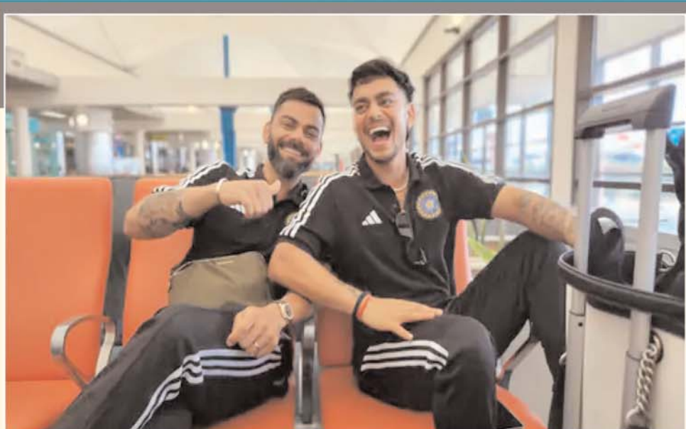
पेज-6 टीम इंडिया डोमिनिका पहुंची, 3 दिन बाद मुकाबला

हुई रल दुघटना में लोगों के मरने पर रल मंत्री को भी इस्तीफा देना पड़ता। लेकिन कहा दिया। मुख्यमंत्री बेशक बंसी नहीं बजा रहे थे, पर चैन में थे। लेकिन इस चैन ने अंततः उन्हें इतना बेचैन कर दिया कि आखिरकार एक दिन उन्होंने इस्तीफा दे ही दिया। यह तो अनहोनी थी। खूद मणिपुर की जनता इससे बेचैन हो उठी कि मुख्यमंत्री ने ऐसी अनहोनी को होनी कैसे होने दिया। क्या उनके प्यार का मुख्यमंत्रीजी यह सिला देगा। सो वे मुख्यमंत्री आवास पहुंच गए और मुख्यमंत्री के हाथ से इस्तीफा लेकर उसे चिंदी-चिंदी कर मिट्टी में रला दिया। किसी उद्यमी ने बाद में उन चिंदियों को जोड़ा और उसे संग्रहालय में रखने योग्य बना दिया। इस तरह मुख्यमंत्री ने कृसियों से चिपके नेताओं को एक रास्ता दिखा दिया कि कोई इस्तीफा मांगे तो इस तरह इस्तीफा देने में कोई हर्ज भी नहीं है।