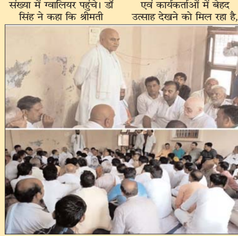
प्रियंका गांधी के होने वाले कार्यक्रम को लेकर पदाधिकारी इससे साफ है कि भाजपा के कुशासन से जनता त्रस्त है