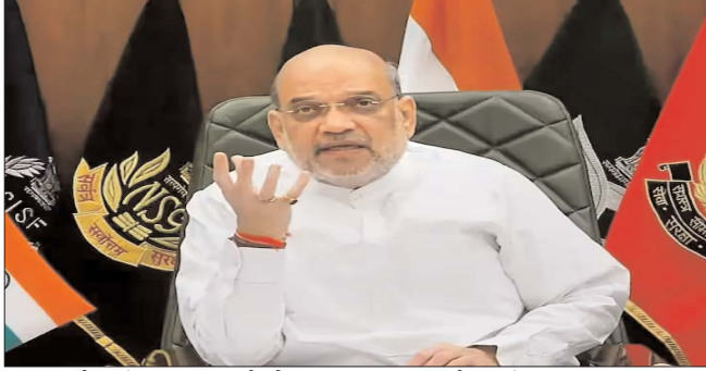
शुरू हो गईं। अधिकारियों ने कहा कि दूसरे मार्ग, बालटाल पर यात्रा

और हिमाचल के सीएम सुखविंदर सिंह सुक्खू से भी फोन पर बात कर मदद की पेशकश की। गृहमंत्री ने कहा कि दोनों राज्यों में एनडीआरएफ की टीमों हैं, लेकिन उसके बावजूद जरूरी लगे तो और भी टीमों तैनात की जा सकती हैं। इस मार्ग पर शुरू हुई यात्रा-बारिश की वजह से 270 किमी लंबे रास्ते में कई भूस्खलन हुए थे। हालांकि, मौसम की स्थिति में सुधार के बाद पहलगाव मार्ग पर यात्रा आज दोपहर को फिर से