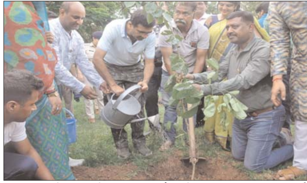
रूमा नाजसहित सामाजिक संस्था, मिडिया बंधु, गणमान्य नागरिक एवं पुलिस के अधिकारी व कर्मचारी उपस्थित रहे। पौधारोपण के बाद पुलिस अधीक्षक ग्वालियर ने पुलिस लाइन का निरीक्षण भी किया और उपस्थित पुलिस अधिकारियों को पुलिस लाइन परिसर में साफ सफाई तथा रिर्कोर्ड का बेहतर संधारण करने के निर्देश दिये। आज प्रातः पुलिस अधीक्षक ग्वालियर एवं अति. पुलिस अधीक्षक श. अ. ह. र. द्वारा पुलिस लाइन ग्वालियर में विभिन्न प्रकार के पौधों का रोपण किया गया, इस अवसर पर एसपी ग्वालियर ने कहा कि पर्यावरण संरक्षण हम सब की सामूहिक जिम्मेदारी है क्योंकि वृक्ष मानव जीवन के लिए बहुमूल्य हैं। इसलिए हम सभी को अधिक से अधिक पौधारोपण करना चाहिए। उन्होंने रोपण किए गये पौधों की देखभाल करने के निर्देश भी दिए और कहा कि प्रत्येक व्यक्ति को जीवन में कम से कम एक पौधा लगाकर पर्यावरण को शुद्ध बनाए रखने में अपना योगदान देना चाहिए। पौधारोपण के बाद पुलिस अधीक्षक ग्वालियर ने पुलिस लाइन परिसर में साफ-सफाई व पीने के पानी की उचित व्यवस्था करने के निर्देश भी उपस्थित अधिकारियों को दिये। इस अवसर पर अति. पुलिस अधीक्षक शहर (मध्य/यातायात), सीएसपी लश्कर, सूबेदार रूमा नाज, सूबेदार अजय प्रताप, सूबेदार आयुष मिश्रा व पुलिस लाइन के अन्य पुलिस अधिकारी व कर्मचारीगण उपस्थित रहे।