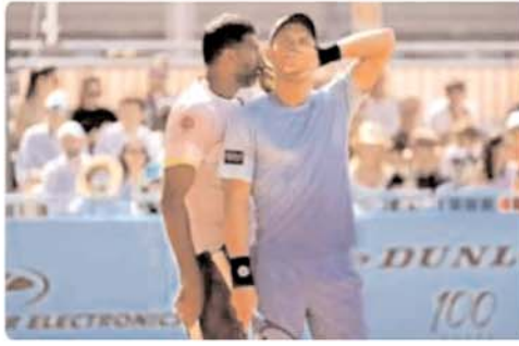
जगह बनाई है। कुल मिलाकर, 2010 में यूएस ओपन उपविजेता बोपन्ना ने पुरुष युगल में चार ग्रैंड स्लैम सेमीफाइनल में जगह बनाई है। छठी वरीयता प्राप्त जोड़ी अब फाइनल में जगह बनाने के लिए

लंदन। शीर्ष भारतीय युगल खिलाड़ी रोहन बोपन्ना और उनके ऑस्ट्रेलियाई जोड़ीदार मैथ्यू एबडेन ने अपना स्वफिनिश प्रदर्शन जारी रखते हुए विंबलडन के युगल वर्ग के सेमीफाइनल में प्रवेश कर लिया है। बोपन्ना-एबडेन की जोड़ी ने टालोन ग्रिक्सपुर और बार्ट स्टीवंस की डच जोड़ी को 6-7(6-3) 7-5 6-2 से हराकर सेमीफाइनल में जगह बनाई। पहले दो सेट में संघर्ष करने के बाद तीसरा सेट बोपन्ना और एबडेन के लिए आसान था। दोनों ने पहले और पांचवें गेम में दो बार डच जोड़ी की सर्विस तोड़ी। यह मुकाबला एक घंटे और 54 मिनट तक चला।