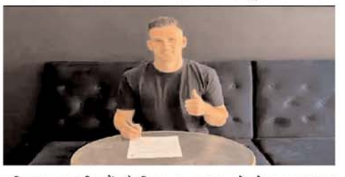
जूनियर स्तर पर नीदरलैंड के लिए भी खेला। उन्होंने डच अंडर -17 और अंडर -18 के लिए कुल 8 मैच खेले। डच इंटरवियस और होगरियन फर्स्ट डिवीजन दोनों में 100 से अधिक मैच और

मुख्य कोच के साथ सकारात्मक बातचीत के कारण मरे लिए मुंबई सिटी को चुनना आसान निर्णय हो गया। हमारे पास एक मजबूत टीम है और क्लब के लिए मुख्य कोच का दृष्टिकोण और जिस तरह से वह खिलाड़ियों से प्रदर्शन चाहता है, वह फुटबॉल के खेल को मेरे देखने के नजरिये से मेल खाता है। इसके अलावा, मुंबई सिटी भारत का सबसे बड़ा क्लब है और यह तथ्य कि क्लब एफसी चैंपियंस लीग में खेलता है, मुझे एशिया में अच्छे प्रदर्शन करने के लिए उस मंच पर प्रतिस्पर्धा करने के लिए उत्साहित करता है। मैं इसी तरह की मानसिकता और माहौल में रहना चाहता हूं। मैं मुंबई पहुंचने और इस नई यात्रा को शुरू करने के लिए उत्साहित हूं। प्रबंधन और