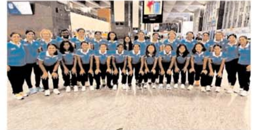
शुरुआत 25 जुलाई को मेजबान स्पेन के खिलाफ करेगा, जबकि उसका अगला मुकाबला 27 जुलाई को दक्षिण अफ्रीका से होगा। भारत का आखिरी रफ मैच