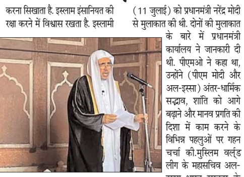
संदेश भूगोल, संदर्भ और विविधता का सम्मान करता है। सच्चा आस्तिक सीधे रास्ते पर चलता है। सच्चे आस्तिक को दयालु हृदय का होना चाहिए, जो लोग हिंसा का मार्ग अपनाते हैं, उनकी हार होगी। बता दें कि अल-इस्सा ने मंगलवार

भारत की पांच दिवसीय यात्रा पर आए मुस्लिम वर्ल्ड लीग के महासचिव शेख मोहम्मद बिन अब्दुलकरीम अल-इस्सा ने दिल्ली की जामा मस्जिद में शुक्रवार (14 जुलाई) की नमाज अदा की। इस दौरान अपने खुबा (भाषण) में उन्होंने कहा, इस्लाम दोहरी बातें पसंद नहीं करता है। मुस्लिमों को सच्चा होने जरूरत है। इस्लाम अहिंसा के प्रति दयालु जरूर होना चाहिए। इस्लाम में अतिवाद के लिए कोई जगह नहीं है। हमें अपने अपने पड़ोसियों का खयाल रखने की जरूरत है। मुस्लिम वर्ल्ड लीग के महासचिव ने बताया इस्लाम क्या सिखाता है। शेख मोहम्मद बिन अब्दुलकरीम अल-इस्सा ने कहा, इस्लाम संपूर्ण मानवता का सम्मान