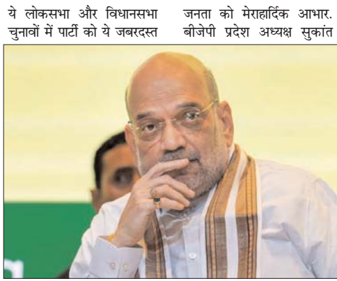
उंचाइयों तक ले जाएंगे शाह ने आगे कहा कि पश्चिम बंगाल की मजबूत और बीजेपी नेता शुभेंदु अधिकारी को बहुत बधाई कि वो

पश्चिम बंगाल के पंचायत चुनाव में मुख्यमंत्री ममता बनर्जी की पार्टी तृणमूल कांग्रेस ने बड़ी जीत हासिल की। वहीं दूसरे नंबर पर बीजेपी रही। इसी बीच केंद्रीय गृह मंत्री अमित शाह ने शुक्रवार (14 जुलाई) को कहा कि खून खराबे वाली हिंसा भी बीजेपी को चुनाव में शानदार प्रदर्शन करने से नहीं रोक सकी। शाह ने ट्वीट किया, बीजेपी ने पिछले चुनाव की तुलना में अपनी सीटों की संख्या लगभग दोगुनी कर ली है। ये हमारी पार्टी पर लोगों के किए गए विश्वास का संकेत है। इससे पता चलता है कि जनता का स्नेह प्रधानमंत्री नरेंद्र मोदी के नेतृत्व वाली बीजेपी सरकार के साथ है। निश्चित रूप से