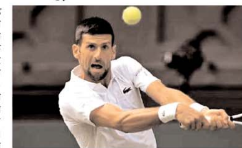
भिड़े थे, जहां सर्बियाई खिलाड़ी ने जीत हासिल की थी। जोकोविच ने रुबलेव के बारे में कहा, 'मैंने जब ग्रैंड स्लैम में

लंदन। सर्बिया के दिग्गज टेनिस खिलाड़ी नोवाक जोकोविच साल के तीसरे और कुल 24वें ग्रैंड स्लैम खिताब की ओर कदम बढ़ाते हुए विंबलडन 2023 के सेमीफाइनल में पहुंच गए हैं। जोकोविच ने खेले गये क्वार्टरफाइनल में रूस के आदि रुबलेव के खिलाफ पिछड़कर वापसी करते हुए 4-6, 6-1, 6-4, 6-3 से जीत हासिल की। फाइनल में जगह बनाने के लिए जोकोविच का मुकाबला इटली के आठवीं वरीयता प्राप्त जैकिक सिनर से होगा। सिनर ने रूस के रोमन सफीउलिन को 6-4, 3-6, 6-2,