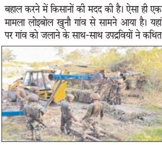
बहाल करने में किसानों की मदद की है। ऐसा ही एक मामला लोइबोल खुनी गांव से सामने आया है। यहां पर गांव को जलाने के साथ-साथ उपद्रवियों ने कथित तौर पर प्रोजेक्ट को क्षतिग्रस्त कर दिया गया था। सूत्रों ने आईएनएस को बताया कि लीमम नाम के एक अन्य गांव में पानी की आपूर्ति भी प्रभावित हुई थी,

नई दिल्ली। हिंसा प्रभावित मणिपुर में केंद्रीय बलों और विशेष रूप से असम राइफल्स की तैनाती पर बढ़ते विवाद के बीच, सुरक्षाकर्मी और अधिकारी स्थानीय किसानों की मदद के लिए महत्वपूर्ण भूमिका निभा रहे हैं। असम राइफल्स के एक सूत्र ने कहा कि हम अपनी उपस्थिति और एरिया डोमिनेशन के माध्यम से सुरक्षा प्रदान कर रहे हैं। दशकों तक, बल को पहचाने लोगों का मित्र भी कहा जाता था, लेकिन समय-समय पर उन्हें आलोचना का भी सामना करना पड़ा या सामाजिक-राजनीतिक संगठनों की जांच के दायरे में आना पड़ा। लेकिन हाल ही में, मणिपुर में हिंसा प्रभावित बस्तियों में जहां सिंचाई और जल आपूर्ति परियोजनाओं को उपद्रवियों ने क्षतिग्रस्त कर दिया था, वहां असम राइफल्स के अधिकारियों और कर्मियों ने जल आपूर्ति