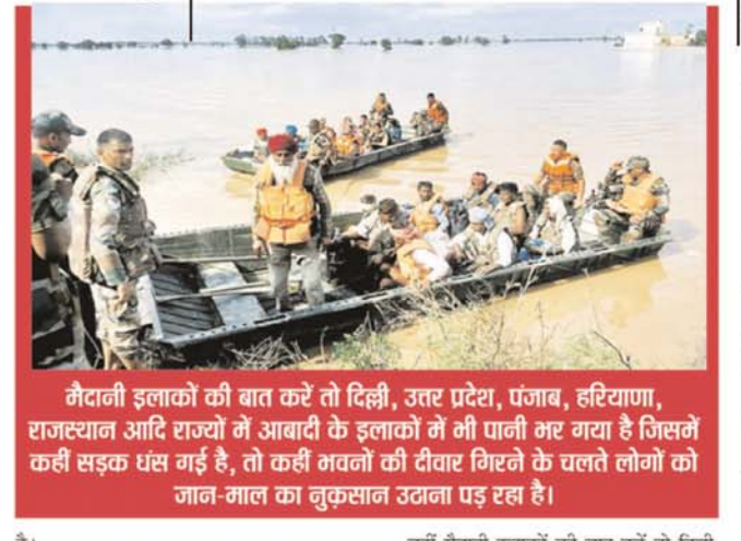
मैदानी इलाकों की बात करें तो दिल्ली, उत्तर प्रदेश, पंजाब, हरियाणा, राजस्थान आदि राज्यों में आबादी के इलाकों में भी पानी भर गया है जिसमें कहीं सड़क धंस गई है, तो कहीं कहीं सड़क धंस गई है, तो कहीं कहीं मवलों की दीवार गिरने के चलते लोगों को जान-माल का नुकसान उठाना पड़ रहा है।

कभी भीषण गर्मी के प्रकोप को झेल रहा उत्तर भारत मानसून का बहुत ही बेसब्री से इंतज़ार कर रहा था, लोगों को उम्मीद थी कि मानसून उनको राहत देगा, लेकिन मानसून के सीजन में जब बारिश को लोगों को प्रचंड गर्मी से राहत देनी थी, उस चक्र लोगों के लिए बारिश एक बहुत बड़ी आफत बन गयी। जल प्रलय से जगह-जगह नदी-नालों में हो रहे भारी उफान ने जलभराव, जबरदस्त भू-कटाव व मलबे ने बड़ी आफत देने का कार्य कर दिया। पिछले कई दिनों से देश के विभिन्न हिस्सों में बादलों की प्रचंड गर्जना के साथ पहाड़ से लेकर मैदान तक हर तरफ कुदरत की मार के चलते भयंकर तबाही का मंजर बन गया है, जिसने लोगों को बेचर करते हुए 19 लोगों के अनमोल जीवन को लीलने का दुःख कार्य कर दिया है। देश की राजधानी दिल्ली से लेकर जम्मू-कश्मीर, हिमाचल, पंजाब, हरियाणा, राजस्थान, उत्तर प्रदेश, उत्तराखंड आदि राज्यों में इस बार जुलाई माह में अपेक्षाकृत ज्यादा हो रही बारिश ने लोगों का जीना-बेहाल करके रखा दिया