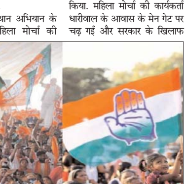
प्रदर्शन कर रहे हैं। नई सहगा राजस्थान अभियान के तहत बीजेपी महिला मोर्चा की कार्यकर्ता महिला मोर्चा की कार्यकर्ताओं ने कैबिनेट मंत्री शांति धारीवाल के सरकारी आवास पर पहुंचकर चमच-थाली बजाकर जमकर प्रदर्शन किया तो वहीं कांग्रेस ने मणिपुर हिंसा को मुद्दा बनाते हुए कांग्रेस कार्यालय से लेकर शहीद स्मारक तक पैदल मार्च निकाला।

नई दिल्ली। राजस्थान में मणिपुर और लाल डायरी मुद्दे को लेकर कांग्रेस-भाजपा आमने सामने हैं और जमकर विरोध प्रदर्शन कर रहे हैं। राजधानी जयपुर में आज लाल डायरी और कानून व्यवस्था को लेकर भाजपा की महिला मोर्चा कार्यकर्ताओं ने कैबिनेट मंत्री शांति धारीवाल के सरकारी आवास पर पहुंचकर चमच-थाली बजाकर जमकर प्रदर्शन किया तो वहीं कांग्रेस ने मणिपुर हिंसा को मुद्दा बनाते हुए कांग्रेस कार्यालय से लेकर शहीद स्मारक तक पैदल मार्च निकाला। राजस्थान के सीकर में कल प्रधानमंत्री नरेंद्र मोदी का दौरा है। पीएम मोदी के दौरे से पहले राजस्थान में कांग्रेस-भाजपा जमकर स्थानीय मुद्दों को लेकर विरोध