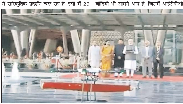
नेताओं की बैठक भी होगी। उद्घाटन के दौरान सेंटर बेहद भी सुंदर और भव्य नजर आ रहा है।

नई दिल्ली। पीएम नरेंद्र मोदी बुधवार को प्रगति मैदान पहुंचे और डॉन के जरिये आईटीपीओ कॉम्प्लेक्स भारत मंडपम का उद्घाटन किया। इससे पहले उन्होंने पुनर्विकसित भारत व्यापार संवर्धन संगठन में पूजा पाठ किया और इसके निर्माण में शामिल मजदूरों से बातचीत कर उन्हें सम्मानित किया है। इस मौके पर प्रधानमंत्री मोदी के साथ केंद्रीय मंत्री पीयूष गोयल भी उपस्थित थे। इस नए कन्वेंशन सेंटर का भारत मंडपम रखा गया है। प्रगति मैदान में दृष्टांत कॉम्प्लेक्स के उद्घाटन के दौरान पीएम नरेंद्र मोदी ने स्मारक टिकट और सिक्के जारी किए हैं। आपको बता दें कि प्रगति मैदान में आईटीपीओ कॉम्प्लेक्स को 2700 करोड़ रुपये की लागत से तैयार किया गया है। ये कन्वेंशन सेंटर 122 एकड़ भूभाग में बना है, जिसे देश के सबसे बड़े सम्मेलन, बैठक और प्रदर्शनों के रूप में निर्माण किया गया है। प्रधानमंत्री नरेंद्र मोदी द्वारा उद्घाटन करने के बाद नए परिसर भारत मंडपम