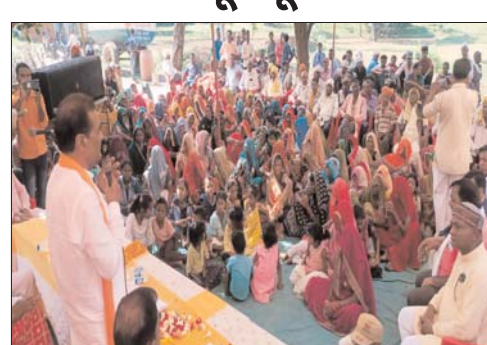
की लागत से निर्मित होने वाले सामुदायिक भवन के भूमिपूजन साथ ही ग्राम पंचायत गंगासागर में 07 लाख 34 हजार के पीसीसी सड़क एवम अन्य विभिन्न विकास कार्यों के भूमिपूजन, ग्राम देवराजनगर में 09 लाख 50 हजार की लागत से निर्मित होने वाले सामुदायिक भवन का लोकार्पण बतौर मुख्य अतिथि स्थानीय जन प्रतिनिधियों की विशेष उपस्थिति में किया, जिस दौरान भाजपा कार्यकर्ता व आमजन काफी संख्या में उपस्थित रहे