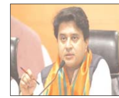
शामिल होंगे। केन्द्रीय मंत्री सिंधिया 28 जुलाई को दोपहर लगभग 2 बजे शीलनगर चंदनराय वाटिका में आयोजित स्थानीय कार्यक्रम में सम्मिलित होंगे

ग्वालियर। केन्द्रीय नागरिक उड्डयन एवं इस्पात मंत्री ज्योतिरादित्य सिंधिया 28 व 29 जुलाई को ग्वालियर जिले के प्रवास पर रहेंगे। इन दिवसों में श्री सिंधिया विभिन्न स्थानीय कार्यक्रमों में भाग लेंगे। निर्धारित कार्यक्रम के अनुसार केन्द्रीय मंत्री सिंधिया 28 जुलाई को प्रातः लगभग 9.10 बजे नई सड़क स्थित संघ कार्यालय पहुंचेंगे। इसके बाद प्रातः 9.25 बजे हनुमान घाटी शिदे की छावनी और प्रातः 9.45 बजे पुरानी पुलिस चौकी के समीप स्थित जगतपुरा नं. 1 लथेड़ी में स्थानीय कार्यक्रम में सम्मिलित होंगे। सिंधिया प्रातः लगभग 10 बजे शीतला माता रोड़ होते हुए ग्राम अमरील के लिये रवाना होंगे। अमरील में स्थानीय कार्यक्रम में शामिल होने के बाद केन्द्रीय मंत्री सिंधिया प्रात 11.35 बजे घाटीगाँव पहुंचकर स्थानीय कार्यक्रम में शामिल होंगे। केन्द्रीय मंत्री सिंधिया 28 जुलाई को दोपहर लगभग 2 बजे शीलनगर चंदनराय वाटिका में आयोजित स्थानीय कार्यक्रम में सम्मिलित होंगे