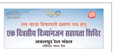
रेल यात्रा रियायती प्रमाण पत्र हेतु एक दिवसीय दिव्यांगजन सहायता शिविर जबलपुर रेल मंडल पश्चिम मध्य रेल

रीवा। रीवा रेलवे स्टेशन में पहली बार दिव्यांग जनों के लिए 28 जुलाई को सुबह 10:00 बजे से शाम 5:00 बजे तक रियायती शिविर का आयोजन किया जा रहा है। जिसमें जबलपुर से अधिकारियों का दल भी शामिल रहेगा। रीवा रेलवे स्टेशन के स्थानीय अधिकारियों से मिली जानकारी के अनुसार ऐसे दिव्यांगजन जो रेल यात्रा में किराए में छूट की पात्रता रखते हैं उनको इसके संबंध में प्रमाण पत्र शिविर के माध्यम से जारी किया जाएगा ताकि उन्हें सतना या जबलपुर के लिए परेशान ना होना पड़े बल्कि सारे कार्य स्थानीय स्तर पर ही पूरे हो जाएं। अधिकारियों ने ऐसे दिव्यांगजन जो रेल रियायत के लिए पात्रता रखते हो उन्हें 28 जुलाई को 10:00 बजे सुबह से लेकर शाम 5:00 बजे तक रीवा रेलवे स्टेशन पहुंचने के अपेक्षा की है