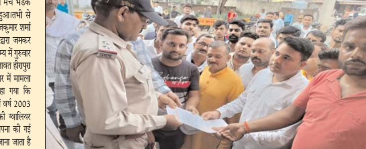
अपमानजनक है इस प्रकार का कृच के जिम्मेदार अधिकारियों द्वारा किया गया है जो कि माफी योग्य नहीं है एवं आगामी समय में भी सूरत में महपुरुषों का अपमान सहन नहीं किया जायेगा अगर ऐसा हुआ तो इसके खिलाफ आंदोलन किया जायेगा। आगे उन्होंने निवेदन किया कि सम्पूर्ण क्षेत्र में महाराणा प्रताप चौराहा के नाम से संवोधित करने हेतु नगर पालिका लहरा को मुनादी करने के लिए अर्दिशित किया जाये एवं संत