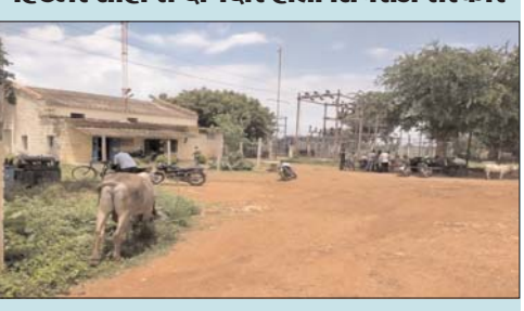
संभागीय ब्यूरो रीवा दैनिक पुष्पांजलि टुडे

मऊगंज। कहने को रीवा से अलग होकर मऊगंज भीषण बिजली समस्याओं से जूझ रहे और यहां के हालात मऊगंज बिजली विभाग के लिए बेकाबू हो गया है। जिससे पार पाना उसके लिए मुश्किल हो चुका है जिससे जनता भीषण आक्रोश है। इससे भाजपा के जनप्रतिनिधियों को अनदेखी के रूप में देखा जा रहा तो वहीं हिटलर शाही पर उतारू अधीक्षण अभियंता रीवा के गौर जिम्मेदाराना रवैया के चलते मऊगंज नगर में बिजली समस्या विकट हो चुकी है। क्योंकि जर्जर हाल के बिजल व ट्रांसफार्मर के बदलवाने को लेकर कोई प्रभावी कदम नहीं उठाया गया है। इस अराजक व्यवस्था से यहां पर प्रदेश में पूर्ववर्ती कांग्रेस की दिग्गी सरकार सरीखे हालात बन चुके हैं। जहां पर बिजली लाइन और ट्रांसफार्मर पूरी तरह से जर्जर हालत में होने से यहां पर बिजली की समस्या भयावह रूप धारण कर चुकी है। तो वहीं गरीब जनता को भारी भरकम बिजली बिल थमाने ने जानाक्रोश पनप रहा है।