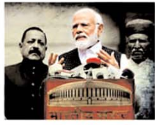
मोदी की ओर से शूद्र मानवीय प्रतिक्रिया नहीं दी जा सकती थी?

उनकी पूरी प्रतिक्रिया मणिपुर की भीषण त्रासदी को लेकर सहानुभूति की कमी पर भी आधारित हो सकती है। मोदी ने मणिपुरी महिलाओं के सार्वजनिक अपमान और सामूहिक बलात्कार पर दुख और गुस्सा व्यक्त किया, लेकिन उनका पूरा बयान ऐसा था जो मूल रूप से राजनीति को संबोधित कर रहा था। क्या केवल इस एक अवसर पर