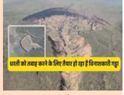
पृथ्वी को तबाह करने के लिए तैयार हो रहा है विशाल गड्ढा