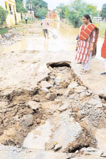
नीची रीवा शहर में बड़ी बड़ी बिल्डिंग, मॉल, स्पोर्ट्स कॉम्प्लेक्स तो बन गए लेकिन लोगों को जो मूलभूत सुविधाएं चाहिए उसे नजरअंदाज कर दिया गया। नगर निगम का एक बड़ा बजट हर साल नाली और सड़क पर खर्च होता है। फिर भी लोग परेशान हैं। पानी निकासी की पर्याप्त व्यवस्था ही नहीं है। बारिश पूर्व नालों की सफाई तक नहीं की जाती। अधिकारी और नेता बदलते हैं लेकिन लोगों की समस्याएं जस की तस ही रह जाती हैं। गलियों से होकर निकाले जनदर्शन यात्रा-रीवा में 10 तारीख को मुख्यमंत्री का यात्रादर स्वागत होने वाला है। जनदर्शन कार्यक्रम के तहत रथ यात्रा निकाली जाएगी। इस रथयात्रा को रीवा की मुख्य सड़कों से होकर ही गुजर जाएगी। ऐसे में मुख्यमंत्री को रीवा की वास्तविक स्थिति का पता नहीं चल पाएगा। रीवा के हालात से सीएम को वाकिफ होना है तो इन्हें रीवा की खराब सड़कों से होकर गुजरना चाहिए। तब वह यहां के लोगों की असल परेशानी से वाकिफ हो पाएंगे।

दैनिक पुष्पांजलि टुडे रीवा। रीवा को लगे विकास के पंख अब रास नहीं आ रहा। इस विकास को लोग पचा नहीं पा रहे हैं। बारिश में पूरा शहर तहस-नहस हो गया। सड़कें चलने लायक नहीं हैं। उस पर सीवर लाइन के काम ने और मुसीबत खड़ी कर दी है। हालात तो यह है कि सड़क पर चलते चलते कब आपकी गाड़ी जमीन के नीचे धंस जाएगी पता ही नहीं चलेगा। कुछ ऐसा ही नजारा वार्ड क्रमांक 10 में देखने को मिला। रीवा। घटना बुधवार की रात की है। तेज झमाझम पानी बरस रहा था। वार्ड क्रमांक 10 आनंदपुर में शिव पार्क के सामने सड़क पर घुटनों तक पानी था। दो वाहन चालक इस सड़क पर बड़ी ही सावधानी से गाड़ी लेकर अपने घर की तरफ जा रहे थे। तभी अचानक दोनों गाड़ियाँ एक-एक कर जमीन के नीचे धंसने लगी और वह पूरी तरह से धंस गई। लाख कोशिशों के बाद भी गाड़ी उस से मस नहीं हुई। वाहन चालकों ने गाड़ियों मैसे पर ही छोड़ दी और पैदल ही घर चले गए। इस समस्या की जड़ सीवर लाइन का घटिया काम है। ठेकेदार ने बारिश के पहले ही सीवर लाइन के लिए गड़बड़ खादी थी। उसकी फिलिंग बेहतर तरीके से नहीं की। बारिश हुई और पूरी सड़क नीचे धंस गई। अब लोग इस परेशानी को झेलने के लिए मजबूर हैं। यह हालात सिर्फ एक मोहल्ले या गली की नहीं है। पूरा शहर ही इस समस्या से ग्रस्त है। कहीं लोगों के घर में पानी भर रहा तो कहीं सड़क पर चलने के लिए जगह ही