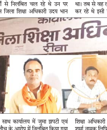
कुछ वर्षों से निलंबित चल रहे थे उन पर था। तब से वह लगातार बहाल होने के प्रयास कर रहे थे इसी संबंध में जब उन्होंने जिला