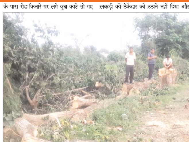
लेकिन स्थानीय लोगों द्वारा उन वृक्षों की कीमती वही आरजी बिल्ड वेल कंपनी के अधिकारी के

किनारे लगे पेड़ किसानों द्वारा अपने घर में ले जा रहे हैं जिससे पेशान होकर एफआईआर करवाने कर्मचारियों को भेजा है लेकिन जब थाने में पता किया गया तो पहले तो आवेदन का ही मना कर रहे थे कि यहां कोई आवेदन नहीं आया है और ना ही कोई एफआईआर हुई है इससे एहसास होता है कि ठेकेदार और ग्रामीणों के बीच मामला सदिये के घेरे में लाता है क्योंकि ठेकेदार द्वारा एफआईआर करना कहा जाता है जब थाने में पता किया जाता है कि क्या ऐसा कुछ मामला है तो थाने वाले मना करते और लाखों रुपए मूल्य की पेड़ों की लकड़ी परिवहन हो चुकी है अब वही रोड के किनारे देखा जाए तो पेड़ गायब हो चुके हैं और कटी हुई डालियां ही नजर आ रही है लग भग 850 पौधे की कटाई होना है जो एक निर्धारित स्थान पर एकत्रित करके नीलाम किया जाना है रोड के किनारे लगे सैकड़ों वृक्ष ठेकेदार के द्वारा काटे तो जा रहे हैं लेकिन वही ठेकेदार उन बहुमूल्य इमारती लकड़ी को शासन द्वारा निर्धारित चयन स्थान पर एकत्रित करने में असहय नजर आ रहा है सहराई चौकी