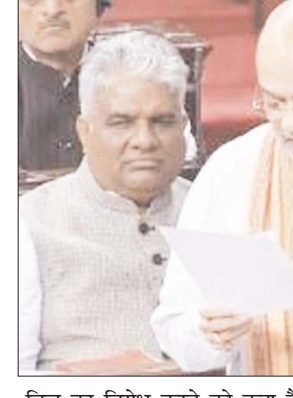
बिल का विरोध करने को कहा है. ट्रांसफर पोस्टिंग को लेकर झगड़े नहीं

नई दिल्ली। दिल्ली सेवा बिल 2023 को लेकर राज्यसभा में चर्चा के दौरान केंद्रीय गृह मंत्री अमित शाह ने कहा कि इस बिल का लक्ष्य दिल्ली में सुचारू रूप से भ्रष्टाचार को खत्म करना है. बिल में प्रावधान से पहले जो भी व्यवस्था थी, उस व्यवस्था में किसी भी तरह का कोई परिवर्तन नहीं किया गया है. उन्होंने कहा कि विधेयक से सुप्रीम कोर्ट के आदेश का भी उल्लंघन नहीं हुआ है. गौरतलब है कि केंद्रीय गृह मंत्री अमित शाह ने सोमवार को राज्यसभा में दिल्ली सेवा बिल को पेश किया. यह बिल लोकसभा से पास हो चुका है. दिल्ली में अधिकारों की जंग वाले इस बिल पर आप को 26 विपक्षी पार्टियों का साथ मिला है. इसके साथ तेलंगाना