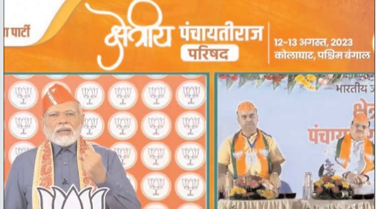
अभी-अभी वहां पंचायत चुनाव हुए इस चुनाव में टीएमसी ने कैसा खूनी खेल खेला, ये भी देश ने

नई दिल्ली। प्रधानमंत्री नरेंद्र मोदी ने शनिवार को वीडियो कॉन्फ्रेंसिंग के जरिए पश्चिम बंगाल के क्षेत्रीय पंचायती राज परिषद को संबोधित किया। इस दौरान पीएम मोदी ने टीएमसी समेत पूरे विपक्षी गठबंधन को जमकर घेरा। इस दौरान प्रधानमंत्री नरेंद्र मोदी ने कहा कि, हमने संसद में विपक्ष के अविश्वास प्रस्ताव को हराया। पीएम मोदी ने कहा कि हमने पूरे देश में नकारात्मकता फैलाने वालों को करारा जवाब दिया। इसके साथ ही मोदी ने अविश्वास प्रस्ताव के वक्त विपक्ष के सदस्य से जाने पर तंज कसा। उन्होंने कहा कि विपक्ष के सदस्य बीच में ही संसद छोड़कर चले गए, सच तो यह है कि वे अविश्वास प्रस्ताव पर वोटिंग से डर रहे थे। पीएम मोदी ने कहा कि सच्चाई ये थी कि विपक्ष अविश्वास प्रस्ताव पर वोटिंग से डर गया था। वो लोग नहीं चाहते थे कि वोटिंग हो। क्योंकि वोटिंग होती तो घमण्डिया गठबंधन की पोल खुल जाती, कौन किसके साथ है, ये दूध का दूध, पानी का पानी हो जाता। इस दौरान प्रधानमंत्री नरेंद्र मोदी ने कहा कि हमारे बीजेपी के कार्यकर्ता पश्चिम बंगाल के उस पुराने वैभवं को लाने के लिए काम कर रहे हैं। इसी के साथ पीएम ने बंगाल की सत्ताधारी पार्टी तुणमूल कांग्रेस पर भी जमकर निशाना साधा। पीएम मोदी ने कहा कि, देखा है, चुनाव में इनका तरीका क्या है, पहले तो चुनाव की तैयारी के लिए समय मत दो, जल्दी-जल्दी फॉर्म भरने की तारीख घोषित कर दो, फिर कोई भी विरोध दल का, कोई भी बीजेपी का कोई