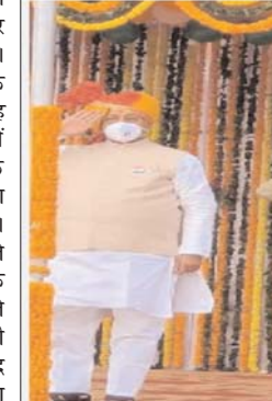
फायर किया जाएगा। इसके बाद प्रातः 9.40 बजे से विभिन्न दलों द्वारा आकर्षक परेड प्रस्तुत की