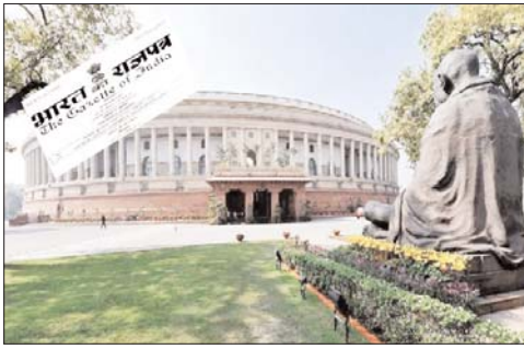
प्रधानमंत्री शामिल किए गए, इसमें 239 के तहत नियुक्त प्रशासक और राष्ट्रपति द्वारा उपराज्यपाल के रूप में नामित किया गया है।

नई दिल्ली। राष्ट्रपति की मंजूरी मिलने के बाद दिल्ली सेवा विधेयक कानून बन गया। इस संबंध में भारत सरकार ने अधिसूचना जारी कर दी, जिसमें राष्ट्रीय राजधानी क्षेत्र दिल्ली सरकार (संशोधन) अधिनियम 2023 को लागू करने के बारे में कहा गया है। बता दें कि एक अगस्त को केंद्रीय गृह मंत्री अमित शाह ने संसद में राष्ट्रीय राजधानी क्षेत्र दिल्ली सरकार (संशोधन) विधेयक, 2023 पेश किया था। गौरतलब है कि यह कानून राष्ट्रीय राजधानी में सेवाओं के नियंत्रण पर अध्यादेश की जगह लेगा। केंद्र की ओर से जारी किए गए नोटिफिकेशन में कहा गया है कि, इस अधिनियम को राष्ट्रीय राजधानी क्षेत्र दिल्ली सरकार (संशोधन) अधिनियम, 2023 कहा जाएगा। इसे 19 मई, 2023 से लागू माना जाएगा। बता दें कि राष्ट्रीय राजधानी क्षेत्र दिल्ली सरकार अधिनियम, 1991 (जिसे इसके बाद मूल अधिनियम के रूप में संदर्भित किया गया है) की धारा 2 में खंड (ई) में कुछ अर्थ राष्ट्रीय राजधानी क्षेत्र दिल्ली के लिए संविधान के अनुच्छेद रूप में नामित किया गया है, बता दें कि इस विधेयक में प्रस्तावित किया गया कि राष्ट्रीय राजधानी के अधिकारियों के निलंबन और पृष्ठताछ जैसी कार्रवाई केंद्र के नियंत्रण में होगी, बता दें कि मानसून सत्र के दौरान सदन में मणिपुर हिंसा पर हंगामे के बीच इस बिल को लोकसभा और राज्यसभा में पेश किया गया था। इस बिल का ज्यादातर विपक्षी दलों ने विरोध किया था, लेकिन संख्या बल कम होने की वजह से केंद्र सरकार का ये बिल दोनों सदनों में पास हो गया और अब कानून बन गया।