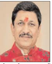
आडवाणी जी व मुरली मनोहर जोशी जी आज भी भारतीय जनता पार्टी के मार्गदर्शक मंडल में हैं। देश का एक एक आदमी चाहता है कि वे स्वास्थ्य रहे सतायू हो। ये दोनों नेता उम्र के अंतिम पड़ाव में है देश के हर व्यक्ति की यह अभिलाषा है कि जो एकबार ये नेता सार्वजनिक मंच और