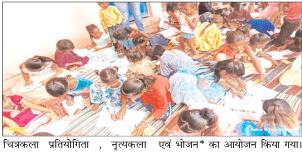
चित्रकला प्रतियोगिता, नृत्यकला एवं भोजन* का आयोजन किया गया।