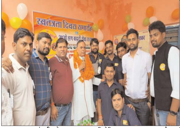
पुष्पांजली टुडे गवालियर। अन्य प्रतियोगिताओं में