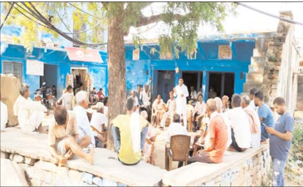
दैनिक पुष्पांजली टुडे

नुककड़ सभाओं के माध्यम से संभावित प्रत्याशी कर रहे हैं कांग्रेस का प्रचार प्रसार