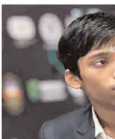
उनके असाधारण प्रदर्शन के लिए शुभकामनाएं दीं। कास्पारोव ने व्यक्ति के रूप में जिसकी गौरवान्वित मां जो उनके साथ हर

नई दिल्ली। पूर्व विश्व शतरंज चैंपियन और रूसी शतरंज ग्रेंडमास्टर गैरी कास्पारोव ने अजरबैजान के बाकु में फिडे विश्व कप के फाइनल में पहुंचने वाले भारतीय ग्रेंडमास्टर रमेशबाबू प्रगानानंद को बधाई दी है। प्रगानानंद ने विश्व नंबर 3 फैबियानो कारुआना को हराकर फिडे विश्व कप के फाइनल में प्रवेश किया। प्रगानानंद के लिए यह उपलब्धि इसलिए भी विशेष हो गई, क्योंकि उनकी मां भी अपने बेटे की जीत देखने के लिए कार्यक्रम में मौजूद थीं। कास्पारोव ने उनकी मां के समर्थन को एक विशेष प्रकार का समर्थन कहा और भारतीय ग्रेंड मास्टर को ट्वीट किया, प्रगानानंद को और उनकी मां को बधाई। एक ऐसे कार्यक्रम में जाती थी, यह एक विशेष प्रकार का समर्थन है। चेन्नई इंडियन ने न्यूयॉर्क के दो काउन्सिलरों को हराया! वह कठिन परिस्थितियों में बहुत दृढ़ रहे हैं। प्रगानानंद ने टाइब्रेक के बाद अमेरिकी खिलाड़ी को 3.5-2.5 से हराया। खिताबी मुकाबले में उनका मुकाबला वर्ल्ड नंबर 1 मैगनस कार्लसन से होगा। इससे पहले, प्रगानानंद ने सडन डेथ टाइब्रेक में हमवतन अर्जुन एरिरीसी को 5-4 से हराकर सेमीफाइनल में जगह पक्की की। 17 वर्षीय प्रगानानंद ने पहले ही अगले साल के कैडिडेट्स इवेंट में जगह पक्की कर ली है।