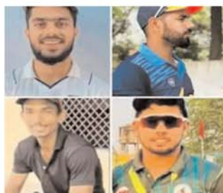
टीम का प्रतिनिधित्व करते हुए कूच बिहार ट्रॉफी में शानदार प्रदर्शन किया। उसके बाद वह उ.प्र.