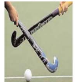
पुनः 32वें, 38वें और 51वें मिनट में एक-एक गोल दागे और मैच को 6-1 से जीत

दबाव बना लिया। 30वें मिनट में एसएसबी की टीम एक गोल कर सकी। इसके बाद साई ने 32वें, 38वें और 51वें मिनट में एक-एक गोल दागे और मैच को 6-1 से जीत लिया। वहीं शाम सवा चार बजे शुरू हुए गुरु गोविंद सिंह स्पोर्ट्स कॉलेज और पुलिस कमिश्नरेंट के बीच मैच में गुरु गोविंद सिंह ने तीसरे और चौथे मिनट में एक-एक गोल कर मनोवैज्ञानिक दबाव बना दिया। इसके बाद 17वें मिनट, 26वें, 55वें, 60वें मिनट में गोल दागे। वहीं पुलिस कमिश्नरेंट मात्र 54वें मिनट में एक गोल कर सका। इस मैच में गुरु गोविंद सिंह स्पोर्ट्स कॉलेज मैच को 6-1 से जीत गया। एसएसबी लखनऊ और शांति फाउंडेशन के बीच हुआ मैच एकतरफा रहा एसएसबी ने मैच को पांच-शून्य से जीत लिया।