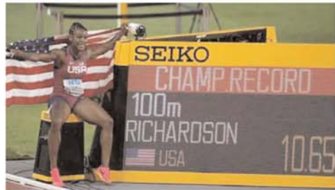
फिर यूजीन में घरेलू धरती पर पिछले साल विश्व एथलेटिक्स के लिए क्वालीफाई करने में असफल रही थीं। बता दें कि टोरी बॉवी की 2017 में जीत के बाद रिचर्डसन महिलाओं की 100 मीटर की पहली अमेरिकी विजेता हैं। बॉवी इस वर्ष 32 वर्ष की आयु में दुनिया को अलविदा कह चुकी हैं।

बुडापेस्ट। संयुक्त राज्य अमेरिका की धाविका 'शा'कारी रिचर्डसन ने विश्व एथलेटिक्स चैंपियनशिप में 100 मीटर रेस में स्वर्ण पदक जीता। रिचर्डसन ने जैम्का की शेरिका जैक्सन को पीछे छोड़ते हुए 10.65 सेकंड के साथ स्वर्ण जीता, जबकि शेरिका ने 10.72 सेकंड के साथ रजत पदक जीता। जैम्का की शेली-एन फ्रेजर-प्राइस, जो चोट से प्रभावित सीजून के बाद 36 साल की उम्र में एक उल्लेखनीय छठे विश्व 100 मीटर खिताब की तलाश में थीं, को 10.77 सेकंड के साथ कांस्य पदक से संतोष करना पड़ा। 23 वर्षीय रिचर्डसन केनिसिस के लिए सकारात्मक परीक्षण के बाद 2021 में टोक्यो ओलिंपिक से चूक गई थीं और 2017 में जीत के बाद रिचर्डसन महिलाओं की 100 मीटर की रहीं थीं। बता दें कि टोरी बॉवी की 2017 में जीत के बाद रिचर्डसन महिलाओं की 100 मीटर की पहली अमेरिकी विजेता हैं। बॉवी इस वर्ष 32 वर्ष की आयु में दुनिया को अलविदा कह चुकी हैं।