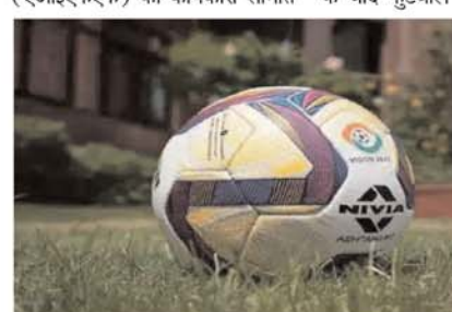
अखिल भारतीय फुटबॉल महासंघ (एआईएफएफ) की कार्यकारी समिति 14 अप्रैल, 2023 को व्यापक चर्चा के बाद फुटबॉल में शौकिया संरचना को समान महत्व देने के निर्णय पर पहुंची थी। समिति ने महसूस किया कि इससे प्रतिस्पर्धी अवसरों का स्तर बढ़ेगा और इस स्तर पर खिलाड़ियों के लिए सुरक्षा सुनिश्चित होगी। इस योजना को क्रियान्वित करने के लिए, कार्यकारी समिति ने वर्तमान सत्र से एक संस्थागत लीग शुरू करने का निर्णय लिया। लीग के विजेताओं को, जहां टीमों का फैसला बोली प्रक्रिया में किया जाएगा, राष्ट्रीय स्तर पर कप टूर्नामेंट में खेलने का मौका मिल सकता है। समिति को विश्वास था कि