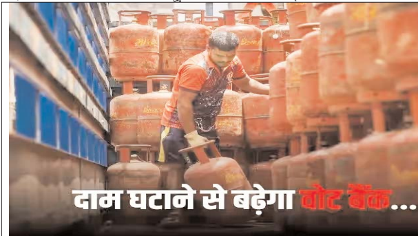
दाम घटाने से बढ़ेगा वोट बैंक...

लोगों ने इस बारे में कोई जवाब नहीं दिया. 200 रुपये सस्ता हुआ सरकार ने गैस सिलेंडर 200 रुपये सस्ता किया. इसके अलावा सरकार ने