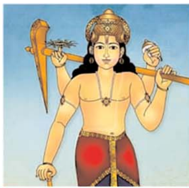
5 सितम्बर: बलराम जयंती

विधिपूर्वक और ससम्मान कराया। विवाहोपरान्त जब वसुदेव देवकी को विदा कराकर ले जाने लगे, तो उस समय कंस रनेह पूर्वक उस दंपति का सारथी बनकर हाँक रहा था और अपनी बहन को वसुदेव के घर पहुंचाने जा रहा था। लेकिन उसी समय आकाशवाणी हुई कि जिस वर पति के घर पहुंचाने जा रहा है, उसी देवकी- वसुदेव का अष्टम पुत्र उसकी मृत्यु का कारण बनेगा। यह सुन उस आशंका का तुरंत अंत करने के लिए कंस- देवकी का अंत करने के लिए तैयार हो गया।