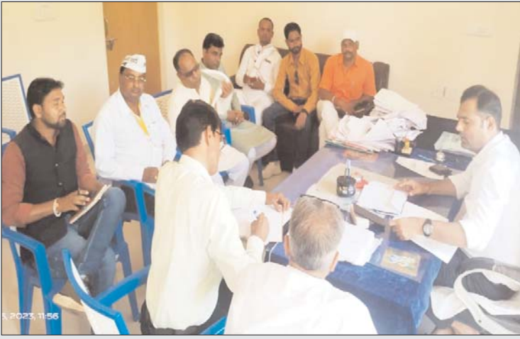
बी बीएलओ द्वारा नाम काटा गया है, तो उसकी जानकारी मुझ तक भेजे में उस पर दंडात्मक मतदाता सूची में हमारी पंचायत में शेष नहीं है सभी के नाम जोड़ दिए गए हैं। साथ ही जो मतदाता

कार्यवाही करूंगा। इसके साथ ही बीएलओ, आंगनवाड़ी कार्यकर्ता, पंचायत सचिव द्वारा यह प्रमाणिकरण भी लिया जायेगा की कोई भी व्यक्ति