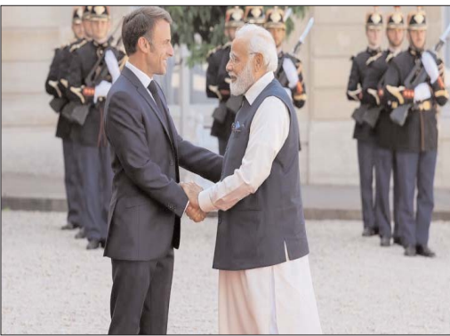
इटली के साथ द्विपक्षीय बैठकें करेंगे फ्रांस के राष्ट्रपति एमैनुएल मैक्रॉन

मोदी यूके, जापान, जर्मनी और और 10 सितंबर को पीएम मोदी