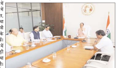
किसानों को फसलों के संबंध में उचित सलाह दें।