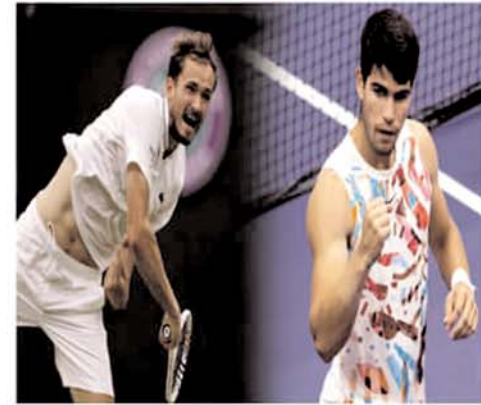
6-4, 6-3, 6-4 से हराने में सफल रहे। मेदवेदेव ने मैच के बाद आगाह किया कि तेज गर्मी के कारण खिलाड़ियों को विकट समस्या से गुजरना पड़ सकता है। उन्होंने कहा, ऐसी परिस्थितियों की आप कल्पना भी नहीं कर सकते। ऐसी स्थिति में किसी खिलाड़ी की जान भी जा सकती है। मैं नहीं जानता कि ऐसी परिस्थितियों में हम क्या कर सकते हैं क्योंकि शायद हम टूर्नामेंट को चार दिन के लिए नहीं रोक सकते हैं। लेकिन परिस्थितियों खतरनाक हैं। अल्कराज अगर सेमीफाइनल में जीत दर्ज करते हैं तो फाइनल में उनका मुकाबला नोवॉक जोकोविच से हो सकता है जिन्हें

न्यूयॉर्क । दुनिया के नंबर एक खिलाड़ी कार्लोस अल्कराज और रूस के तीसरी वरीयता प्राप्त दानिल मेदवेदेव ने मोसम की विकट परिस्थितियों के बावजूद सीधे सेटों में जीत दर्ज करके अमेरिकी ओपन टैनिंग टूर्नामेंट के सेमीफाइनल में जगह बनाई जहां वे एक-दूसरे के आमने-सामने होंगे। पिछली बार के चैंपियन अल्कराज ने जर्मनी के अलेक्जेंडर ज्वेरेव को 6-3, 6-2, 6-4 से पराजित किया। वह अब अमेरिकी ओपन में लगातार दूसरे खिताब के करीब पहुंच गए हैं। रोजर फेडरर ने 2004 से 2008 तक यहां लगातार पांच खिताब जीते थे। इसके बाद पुरुष एकल में कोई भी खिलाड़ी अपने खिताब का बचाव नहीं कर पाया। इससे पहले मेदवेदेव ने भीषण गर्मी के बीच हमबतन ऑट्टे रुबलेव को हराकर चौथी बार अमेरिकी ओपन के पुरुष एकल के सेमीफाइनल में जगह बनाई। फ्लोरिंग मीडोज पर तापमान 35 डिग्री सेल्सियस तक पहुंच गया था और ऐसे में खेलना आसान नहीं था। मेदवेदेव ने मैच के दौरान 'इन्हेलर' का उपयोग किया और चिकित्सक की मदद भी ली। वह हालांकि रुबलेव को