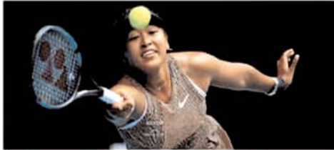
साथ मानसिक स्वास्थ्य पर यूएस ओपन के फोरम में भाग लेने के लिए यूएसटीए विली जीन किंग नेशनल टेनिस सेंटर में थी, उसे 2024 ऑस्ट्रेलियन ओपन में अपनी वापसी की उम्मीद है और वह और अधिक डब्ल्यूटीए खेलने की योजना बना रही है। जैसे-जैसे वह खेल में वापसी करेंगी, दौर का कार्यक्रम तय किया जाएगा। ओसाका ने ईएसपीएन के साथ एक साक्षात्कार में कहा, यह निश्चित रूप से मेरे खेलने से कहीं अधिक टूर्नामेंट है। तो मुझे लगता है कि कुछ

नई दिल्ली । दो बार की यूएस ओपन चैंपियन नाओमी ओसाका ने कहा है कि वह ऑस्ट्रेलिया में अगले सीजन की शुरुआत में पेशेवर टेनिस में वापसी की योजना बना रही हैं। 25 वर्षीय जापानी खिलाड़ी ने सितंबर 2022 में टोरे पेन पैसिफिक ओपन के बाद से नहीं खेला है। वह जनवरी में खेल से दूर हो गईं और जुलाई में अपनी बेटी शाई को जन्म दिया। पूर्व नंबर 1, जो तेराकी के दिग्गज माइकल फेल्ट्स के