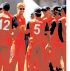
काफी अनुभव है और उनकी मौजूदगी से निदरलैंड की टीम को मजबूती मिलेगी। रयान कुक टीम के मुख्य कोच होंगे। निदरलैंड की टीम 30 सितंबर को ऑस्ट्रेलिया और तीन अक्टूबर को भारत के खिलाफ अभ्यास मैच खेलेगी।

नीयूयेगेन । रीलोफ वान डर मर्व और कॉलिन एकरमेन की अनुभवी जोड़ी को भारत में अगले महीने से होने वाले आईसीसी वनडे विश्वकप के लिए निदरलैंड की 15 सदस्यीय टीम में शामिल किया गया है। यह दोनों खिलाड़ी क्वालीफायर्स में टीम का हिस्सा नहीं थे जिसमें निदरलैंड ने दूसरे स्थान पर रहकर विश्वकप में अपनी जगह सुरक्षित की थी। स्काट एडवर्ड्स को टीम का कप्तान बनाए रखा गया है। वान डर मर्व और एकरमेन दोनों का अंतरराष्ट्रीय स्तर पर खेलने का