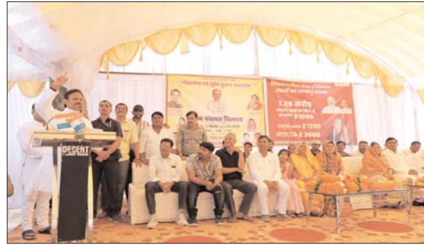
उन्नतशील हुआ है। यहाँ की जमीनों की ग्रामीण क्षेत्रों में भी गरीबी और बेरोजगारी दूर करने के कार्य हो रहे हैं जिससे अब यहाँ के