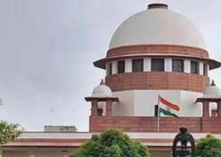
लोन द्वारा 2018 में जम्मू-कश्मीर विधानसभा में पाकिस्तान जिन्दाबाद के नारे लगाने का मुद्दा भी उठा। केन्द्र सरकार ने

पहुंचा है। उन्होंने अदालत से यह भी कहा है कि वह यह भी देखें कि अकबर लोन ने इस हल्फनामे में क्या नहीं लिखा है। लोन ने हल्फनामे में लिखा है कि 'मैं भारत का एक जिम्मेदार नागरिक हूँ। सांसद के रूप में ली गई शपथ को दोहराता हूँ। मैंने भारत के संविधान को बनाए रखने और भारत की अखंडता बनाए रखने की शपथ ली है। सुप्रीम कोर्ट उनके हल्फनामे की समीक्षा कर केन्द्र सरकार ने स्पष्ट कर दिया है कि जम्मू-कश्मीर में मतदाता सूचियों को अंतिम रूप दिया जा रहा है और वहां कभी भी चुनाव कराए जा सकते हैं। चुनावी तिथियों का फैसला निर्वाचन आयोग को करना है। हालांकि केन्द्र ने जम्मू-कश्मीर को राज्य का दर्जा देने के संबंध में कोई समय सीमा नहीं बताई। इसमें कोई संदेह नहीं कि अनुच्छेद 370 हटाए जाने के बाद जम्मू-कश्मीर में आतंकवाद और घुसपैठ की घटनाओं में काफी कमी आई है और पत्थरबाज अब कहीं दिखाई नहीं देते। जम्मू-कश्मीर में शांति बहाली होने के साथ ही देशभर के पर्यटक भारत की अखंडता बनाए रखने और जम्मू-कश्मीर की ओर आकर्षित हुए हैं और कई वर्षों से बंद घसिनेमाघर भी खुलने लगे हैं। श्रीनगर के लालचौक पर पहले की तरह धार्मिक उत्सव आयोजित किए जा रहे हैं और जगह-जगह तिरंगे फहर रहे हैं और कश्मीरी आवाम देश की मुख्यधारा से जुड़ने लगी है। जब हालात पूरी तरह से सामान्य हो जाएंगे तो फिर उसे राज्य का दर्जा भी दिया जाएगा। यह सभी नीतिगत मुद्दे हैं।