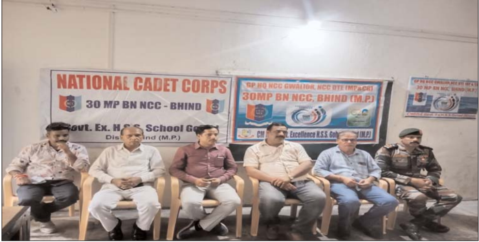
हुए उन्होंने अब्दुल कलाम के जीवन की एक घटना पर प्रकाश