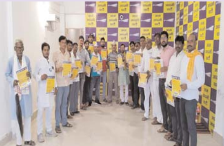
दैनिक पुष्पांजली टुडे

आप पार्टी के कार्यकर्ता घर-घर पहुंच कर पार्टी की गारंटी को बताएं