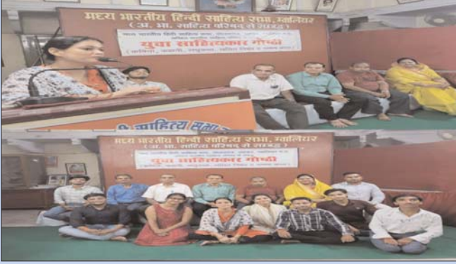
कार्यक्रम में किए गए काव्य पाठ के काव्यांश इस प्रकार रहे। -श्री कृष्ण ही सत्य है मनुज नहीं है सत्य

अतिथियों एवं युवा साहित्यकारों का आभार व्यक्त किया।