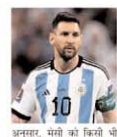
अनुसार, मेसी को किसी भी चोट से मुक्त कर दिया है लेकिन स्कालोनी उनके कार्यक्रम से चिंतित हैं। मेसी ने पिछले 48 दिनों में 12 मैच खेले हैं, जुलाई के मध्य में मुफ्त ट्राइफायर पर इंटर मियामी में शामिल होने के बाद लगातार मैच खेले हैं।

ब्यूनोस आयर्स, ■ आईएनएस/डेस्क एल्बोसेलेस्टो के मैनेजर लियोनेल स्कालोनी ने बताया कि लियोनेल मेसी ला पाज में बोलीविया के खिलाफ विश्व कप क्वालीफायर के लिए अर्जेंटीना की टीम के साथ यात्रा करेंगे। समाचार एजेंसी शिन्तुआ की रिपोर्ट के अनुसार गुरुवार को शुरूआती दक्षिण अमेरिकी जॉन क्वालीफायर में अर्जेंटीना की इक्वाडोर पर 1-0 की परेल्डू जीत के बाद देर रात मेसी ने रविवार को अपने साथियों से अलग प्रशिक्षण लिया। मीडिया रिपोर्टों के