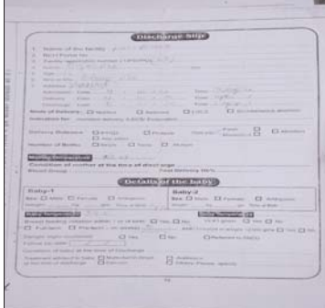
गरीब आदिवासी महिला पढ़े लिखे ना होने के