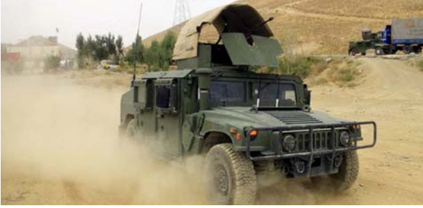
अफगानिस्तान के गजनी प्रांत में हुए हमले के बाद निकलता हुआ एक सेना वाहन।

जन्मस्थली नेपाल का चितवन जिला है। इसी जिले में माडी नगरपालिका क्षेत्र है, जिसका नाम अयोध्यापुरी है। शनिवार को ओली ने इस क्षेत्र के अधिकारियों से फोन पर बातचीत की। उन्हें राम, लक्ष्मण और मां सीता की प्रतिमाएं लगाने के आदेश दिए। ओली ने अफसरों को आदेश दिया कि अयोध्यापुरी को ही असली अयोध्या के तौर पर प्रोजेक्ट और प्रमोट करें। प्रधानमंत्री ओली ने थोरी और माडी के स्थानीय जनप्रतिनिधियों को भय मंदिार बनाने के लिए योजना तैयार करने के निर्देश भी दिए हैं। नेपाल के एक अखबार के मुताबिक ओली ने माडी और चितवन के अधिकारियों और नेताओं से दो फोन पर बातचीत की। आगे बातचीत के लिए उन्हें काठमांडू भी बुलाया। ओली ने कहा, भूदत्त भरोसा है कि भगवान राम का जन्म नेपाल के अयोध्यापुरी में हुआ था। भारत के अयोध्या में नहीं।