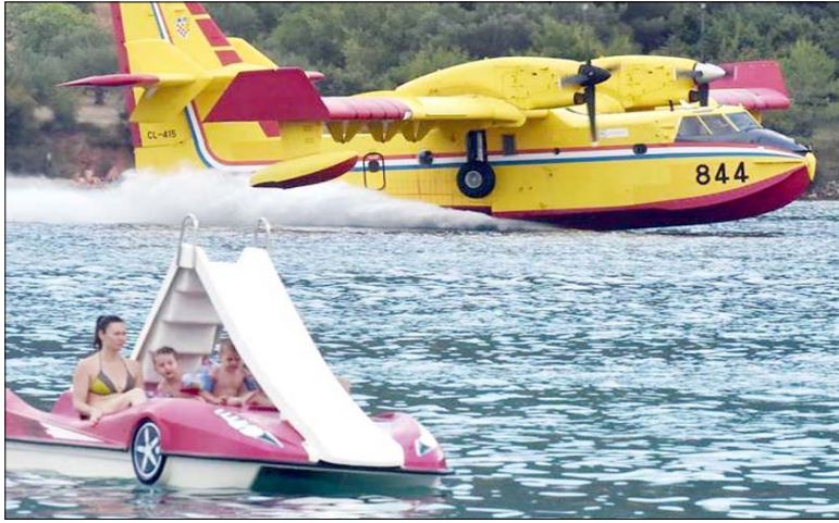
क्रोएशिया में आग बुझाने के काम में लगा एक विमान समुद्र तट के करीब पानी भरते हुए।