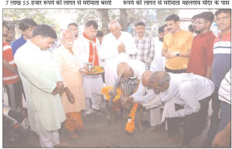
7 लाख 55 हजार रुपये की लागत से मरीमाता बस्ती रूपये की लागत से मरीमाता महलगांव मंदिर के पास में सी.सी.एव नाली निर्माण कार्य, 8 लाख 37 हजार सामुदायिक भवन निर्माण कार्य का भूमि पूजन किया।

गवालियर। ऊर्जा मंत्री प्रद्युम्न सिंह तोमर ने शहर के वार्ड-32 की विभिन्न बस्तियों में पहुंचकर एक करोड़ 85 लाख रुपये के विकास कार्यों की आधारशिला रखी। इस अवसर पर उन्होंने कहा कि उपनगर गवालियर में विकास के नए-नए आयाम स्थापित हो रहे हैं। विकास का यह सिलसिला थमने नहीं दिया जायेगा। उन्होंने कहा कि उपनगर गवालियर की किसी भी बस्ती की कोई भी रोड कच्ची नहीं रहने दी जायेगी। सड़कें बनाने का काम युद्ध स्तर पर किया जा रहा है। ऊर्जा मंत्री तोमर ने वार्ड 32 में 5 लाख 11 हजार रुपये की लागत से लक्ष्मीबाई कॉलोनी तेजसिंह कॉम्प्लेक्स एवं मरीमाता महलगांव हरिजन बस्ती में सी.सी.रोड निर्माण कार्य, 21 लाख 13 हजार रुपये की लागत से एम एल बी कॉलोनी में आर.सी.सी.नाला निर्माण कार्य, 7 लाख 18 हजार रुपये की लागत से गंगादास की शाला शिव मंदिर के पास सामुदायिक भवन निर्माण कार्य, 6 लाख 87 हजार रुपये की लागत से होटल मिडवे से होटल क्लार्कइन तक नाली निर्माण कार्य, 4 लाख 5 हजार रुपये की लागत से मरीमाता महलगांव में सार्वजनिक स्थान पर पेपर ब्लॉक इंटरलॉकिंग कार्य,