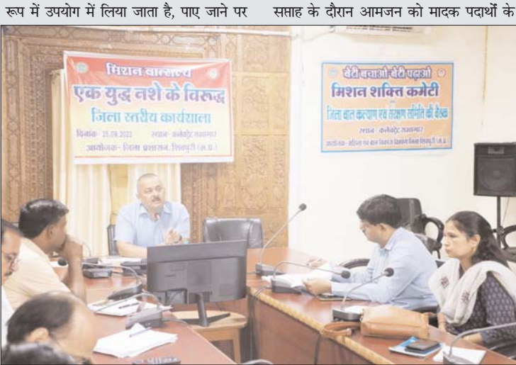
रूप में उपयोग में लिया जाता है, पाए जाने पर ससाह के दौरान आमजन को मादक पदार्थों के निर्देश दिए। उन्होंने शिक्षा विभाग के अधिकारियों एवं समस्त विद्यालयों के प्राचार्यों को भी निर्देश दिए कि विद्यालयों के 100 मीटर की दूरी पर इस प्रकार की गुमटी अथवा स्टॉल न लगाए जाए, यदि किसी के द्वारा लगाई गई है तो हटाने की कार्यवाही करें। इस बात का विशेष ध्यान रखा जाए। इसके संबंध में सभी शासकीय अथवा अशासकीय विद्यालयों में प्रहरी क्लब भी स्थापित किए जाए। इस क्लब में कक्षा 6वीं से 12वीं तक के बच्चों को सम्मिलित किया जाए, जो स्कूल स्तर पर नशीले उत्पादों के हानिकारक प्रभाव के संबंध में जागरूकता पैदा करेंगे एवं औचक चेकिंग के माध्यम से परिसर के आस पास अवैध गतिविधियों के संबंध में स्कूल प्रबंधन समिति अथवा प्राचार्यों को सूचित करेंगे। शैक्षिक परिसर में सीसीटीवी कैमरे का प्रयोग एवं उनका पुलिस, बाल कल्याण अधिकारी, प्राचार्य आदि के द्वारा नियमित निरीक्षण किया जाए। इस मौके पर के विरुद्ध अभियान अंतर्गत हस्ताक्षर अभियान भी चलाया गया। जिसमें कलेक्टर सहित अन्य अधिकारियों ने अपने हस्ताक्षर कर नशा न करने एवं लोगों को जागरूक करने की शपथ ली।