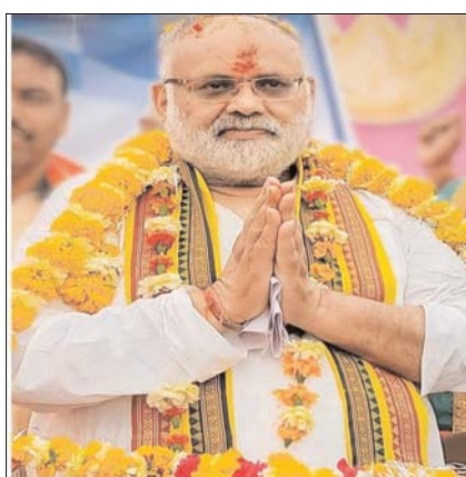
उपर अपना भरसा जताया है।