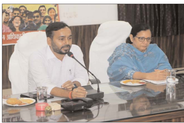
नामांकन जमा करने की अंतिम तिथि 30 अक्टूबर होगी और 31 अक्टूबर को नामांकन पत्रों की संवीक्षा की जाएगी। अभ्यर्थिता से नाम वापसी 2 नवंबर को अपराह्न 3 बजे तक की जा सकेगी। सतना जिले की 5 विधानसभा सतना, नागौद,

रैगांव, रामपुर बधेलान, चित्रकूट और मैहर जिले को 2 विधानसभा क्षेत्र मैहर और अमरपाटन में मतदान 17 नवंबर को होगा और मतगणना 3 दिसंबर 2023 को की