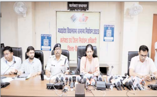
अनुसार सभी तैयारियों की जा रही है। सम्पत्ति कलेक्टर ने बताया कि सभी मतदान केन्द्रों में विरूपण अधिनियम, कोलाहल नियंत्रण पानी, छाया, शौचालय आदि की व्यवस्था कर

तरह से निष्पक्ष संपन्न कराये जायेंगे। विधानसभा चुनाव के लिये निर्वाचन आयोग के निर्देशों के अधिनियम सहित विभिन्न वैधानिक प्रावधानों के तहत लगातार कार्यवाही की जा रही है।