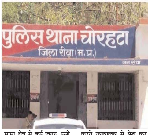
मामा क्षेत्र में कई जगह, इसी करने न्यायालय में पेश कर

के रूप में की गई है। यह चोर आपनी गैंग बनाकर काम कर रहे थे। पहले जानकारी एकत्र करते उसके बाद आपस में मिलकर चोरी की घटना को अंजाम दे रहे थे। चोरों ने किया खुलासा-पकड़ में चोरों की पूरी टीम ने बताया कि वह चोरहटा थाना क्षेत्र के कई स्थानों में चोरी की वारदात को अंजाम दिया है। पुलिस ने कार्यवाही करते हुए चोरों के पास से सोने चांदी के जेवरों बरामद किए हैं। जानकारी मिल रही है कि अब तक की पूछताछ में 12 चोरी