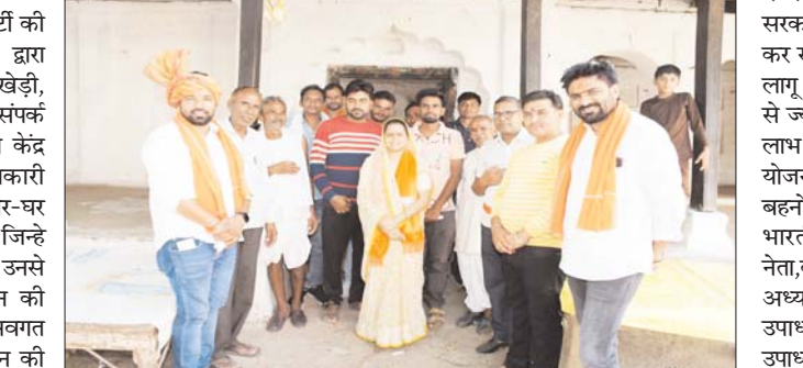
जावेगा। क्योंकि भारतीय जनता पार्टी परिवार को शासन की योजनाओं का

अति शीघ्र लाभ के लिए प्रयास किया का एक ही लक्ष्य है प्रत्येक वंचित