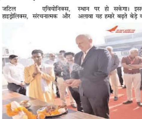
जाटिल हाइड्रोलिक्स, एवियोनिक्स, संरचनात्मक और स्थान पर हो सकेगा। इसके अलावा यह हमारे बढ़ते बेड़े का समर्थन करने और सभी इंजीनियरिंग जरूरतों के लिए वन-स्टॉप समाधान के तौर पर हमारी