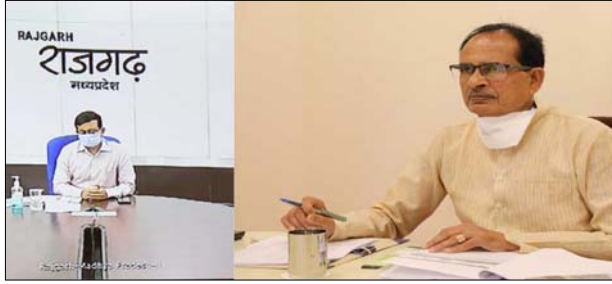
ली। श्री चौहान वीडियो कान्फेंसिंग के माध्यम से प्रदेश में कोरोना की स्थिति की समीक्षा कर रहे थे समीक्षा में बताया गया कि प्रदेश में टेस्टिंग क्षमता में लगातार विस्तार हो रहा है। अब 20 हजार से अधिक टेस्ट प्रतिदिन किए जा रहे हैं। अब तक कोरोना से प्रभावित 42 हजार 618 में से 31 हजार 835 व्यक्ति स्वस्थ हुए हैं। वर्तमान में सक्रिय केस 9 हजार 718 हैं। मुख्यमंत्री श्री चौहान ने राजगढ़ तथा सीधी जिले की विशेष रूप से जानकारी ली। राजगढ़ में 54 कंटेनमेंट एरिया बनाए गए हैं। मास्क न पहनने पर जुर्माना तथा सोशल डिस्टेंसिंग का पालन न करने पर प्रभावी कार्रवाई लगातार जारी है। राजगढ़ कलेक्टर को निर्देश दिए गए हैं कि जो परिवार होम आइसोलेशन के प्रावधानों का पालन नहीं कर रहे हैं, उन्हें संस्थागत क्वारंटाइन में रखा जाए। इसी प्रकार सीधी जिले में प्रकरणों की समीक्षा तथा उपलब्ध क्षमता की जानकारी ली गई। अपर मुख्य सचिव स्वास्थ्य श्री मोहम्मद सुलेमान ने बताया कि होम आइसोलेशन तथा संस्थागत क्वारंटाइन पर विस्तृत दिशा-निर्देश जिलों को जारी किए गए हैं। जबलपुर, मुरैना, खरगोन, नीमच, मंडसौर, रतलाम, सागर, इंदौर जिलों की समीक्षा भी की गई। कोरोना की समीक्षा में गृह मंत्री डॉ. नरोत्तम मिश्र, मुख्य सचिव श्री इकबाल सिंह बैस सहित अन्य अधिकारियों ने भाग लिया।

भोपाल। मुख्यमंत्री श्री शिवराज सिंह चौहान ने कहा है कि कोरोना का रिकवरी रेट 74.7 प्रतिशत हो गया है। सभी जिले मास्क पहनने तथा सोशल डिस्टेंसिंग का पालन अनिवार्यता सुनिश्चित करें। यह कोरोना संक्रमण को रोकने में प्रभावी है। होम आइसोलेशन के साथ-साथ कोरोना की चैन तोड़ने के लिए जहाँ-जहाँ आवश्यक हो वहाँ संस्थागत क्वारंटाइन की व्यवस्था सुनिश्चित की जाए। उन्होंने कहा कि आगे आने वाले त्योंहारों जैसे गणेश उत्सव तथा मोहर्रम आदि में किसी भी तरह का सार्वजनिक आयोजन तथा समागम न हों यह सुनिश्चित किया जाए। इस उद्देश्य से यदि कहीं बड़ी मूर्तियों और ताजिए आदि का निर्माण आरंभ हो रहा है तो उस पर तत्काल पाबंदी लगाई जाए। धार्मिक कार्यक्रम घरों में ही हों, यह सुनिश्चित करें। मुख्यमंत्री श्री चौहान ने जेलों में फैल रहे संक्रमण को गंभीरता से लेने तथा इसके प्रभावी उपाय करने के निर्देश दिए। उन्होंने कहा कि फंडे लाइन शासकीय सेवकों में संक्रमण से बचाव के लिए हरसंभव प्रयास किए जाएं। मुख्यमंत्री श्री चौहान ने दिवांत प्रसिद्ध शावर श्री राहत इंदौरी की मृत्यु के संबंध में भी जानकारी