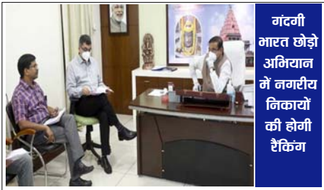
गंदगी भारत छोड़ो अनियान में नगरीय निकायों की होगी टैकिंग