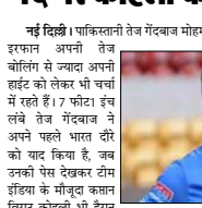
भारत दौर को याद किया है। उन्होंने बताया, जब उन्होंने पहली बार भारत का दौर किया था, तब भारतीय कोचों ने अपने खिलाड़ियों को मेरे स्पिड के बारे में बताया था कि मैं 130-135 की गति से बॉल फेंकता हूँ।

लंदन । तीन बार की विश्व चैंपियन रही इंग्लैंड महिला क्रिकेट टीम की सदस्य खिलाड़ी ऑलराउंडर लाउरा मार्श ने क्रिकेट के सभी प्रारूपों से संन्यास का ऐलान कर दिया है। मार्श ने दिव्य पर इसकी आधिकारिक घोषणा करते हुए लिखा, 'मैंने क्रिकेट के सभी प्रारूपों से संन्यास लेने का निर्णय लिया है। इस वर्ष 'द इंडेपेंडेंट' प्रतिनिधिता के रह जाने के बाद मुझे लगता है कि संन्यास लेने का यह सही समय है। मैं सभी टीमों और संगठनों को बहुत-बहुत धन्यवाद कहना चाहती हूँ, जिन्का मैंने वर्षों प्रतिनिधित्व किया है। मैं उन्हें आमो लिख, 'कैंट और ससेक्स ने मुझे आगे बढ़ने में काफी मदद की जिसकी मैं बहुत आभारी हूँ। सर स्टार्स, सिस्को सिक्सर्स, एनएसडब्ल्यू ब्रेकर्स और आंटानो स्प्याक्स