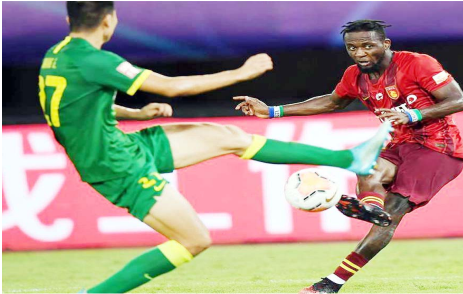
देखें चीन फॉर्ब्स की युवा लुरें (आर) चौथे सीजन में 2020 सीजन के चीनी फुटबॉल एसोसिएशन सुपर लीग (सीएसएल) के एक मैच के दौरान खिलाड़ी गेंद के लिए सघर्ष करते हुए। यह मैच बीजिंग गुओन और देहें वाइना फॉर्ब्स के बीच खेला गया था।